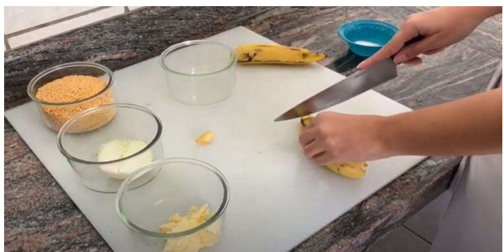
Gravações dos vídeos de receitas com o aproveitamento integral dos alimentos.