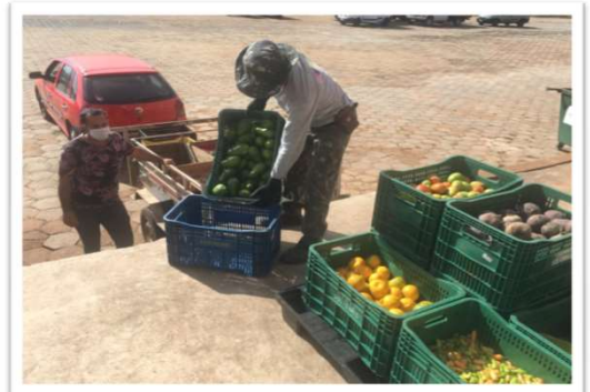
Alimentos distribuídos para as entidades sociais.