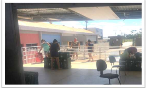
Distribuição para as famílias.