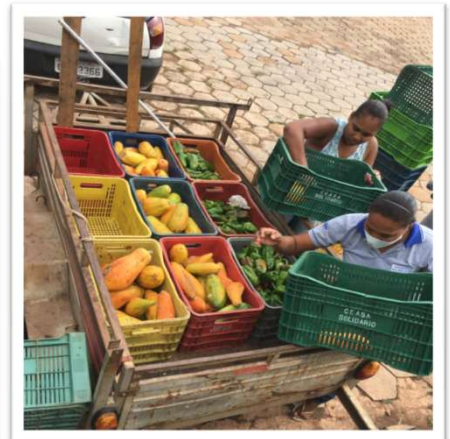
Alimentos distribuídos para as entidades.