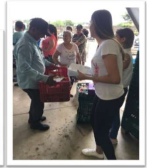
Capacitação sobre aproveitamento integral dos alimentos com as famílias.