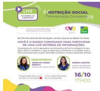
Convite para capacitação com o tema "Nutrição Social e Alimentação Consciente".