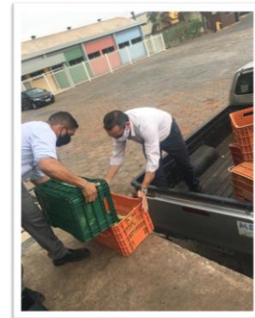
Alimentos distribuídos para as entidades.