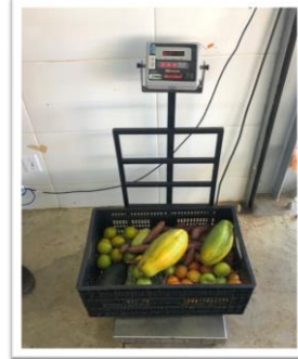
Distribuição para as famílias.