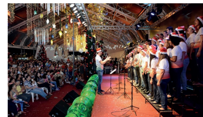
Apresentação do Coral Jovem de Goiânia da Igreja Adventista.

Em Goiânia, na segunda etapa do projeto, a OVG e o Governo do Estado fazem a entrega de brinquedos para as crianças durante a apresentação de um artista de renome nacional. O transporte é feito gratuitamente dos bairros ao local do show e também na volta depois da exibição artística. A distribuição de presentes é feita nos 246 municípios goianos.