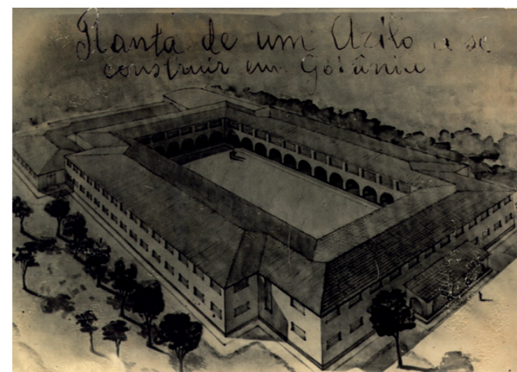
Planta do então chamado Abrigo dos Velhos.

Dirigida por freiras, a unidade atendia a pessoas de todas as idades - jovens, adultos, idosos - em sua maioria deficientes físicos e mentais.