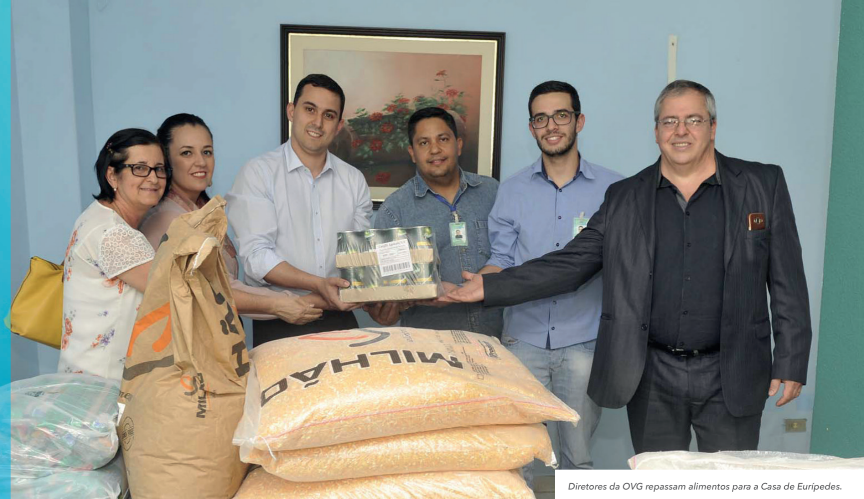
Diretores da OVG repassam alimentos para a Casa de Eurípedes.

Assistência contribui para melhoria da qualidade de vida de crianças, jovens, idosos, dependentes químicos, pessoas com deficiência e economicamente vulneráveis.