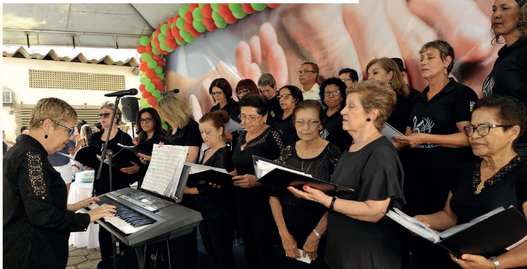
Coral Voz Solidária do CGV.