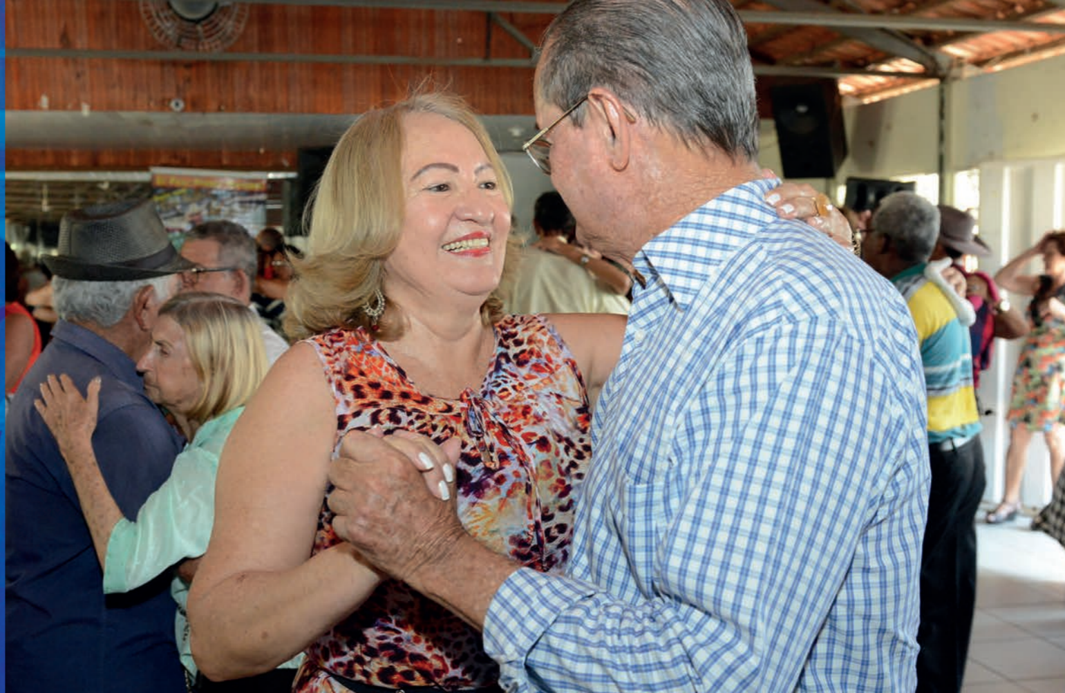
Idosos participam de tarde dançante.

Inaugurada em 1994, unidade surgiu de conjunto habitacional com 30 casas para idosos independentes e aposentados. Eram oferecidos somente os serviços de assistência social e enfermagem. Bailes dançantes, que atraem hoje grande número de idosos, já era uma prática na unidade nos seus primeiros tempos.