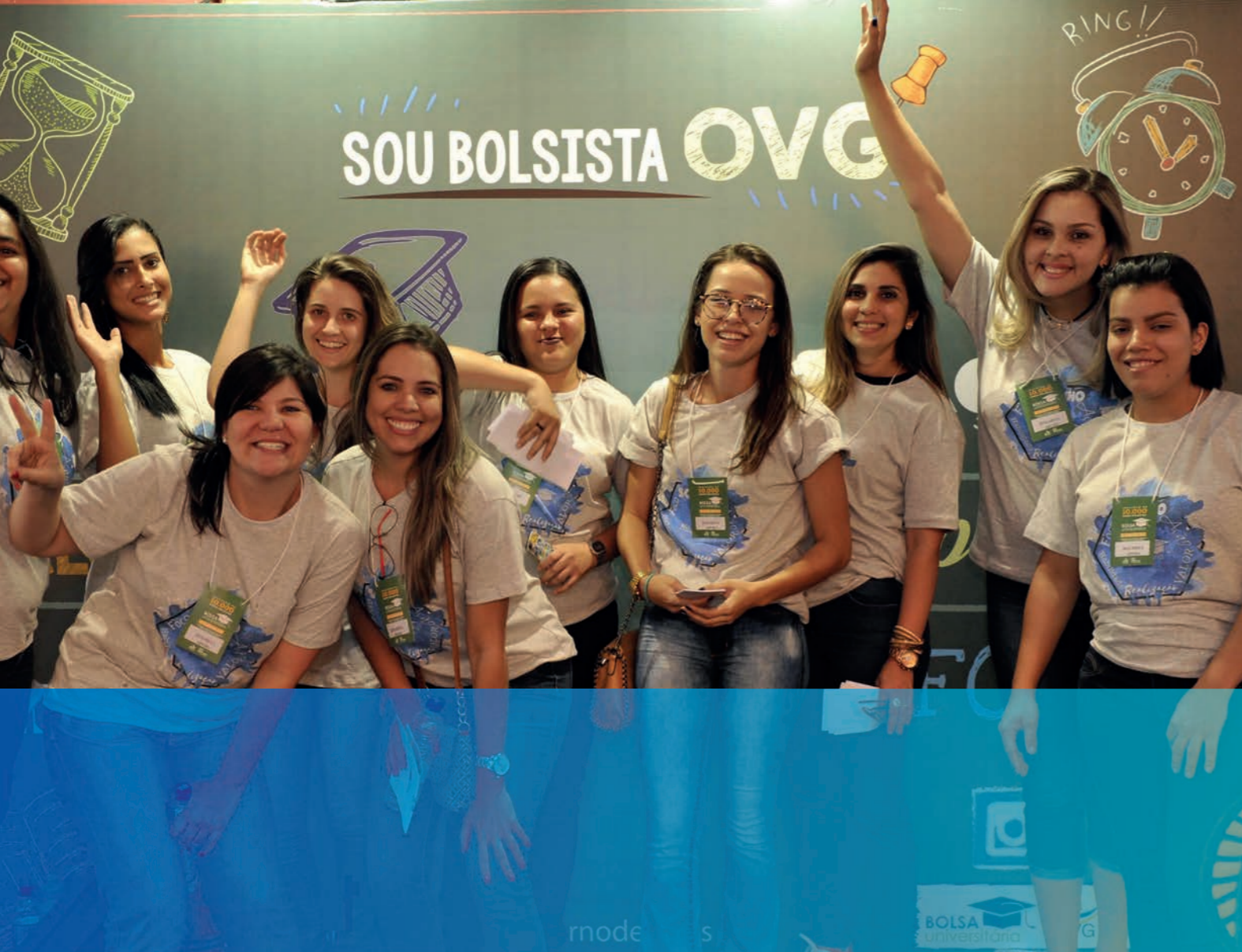
Bolsistas comemoram inclusão no PBU em 2017.