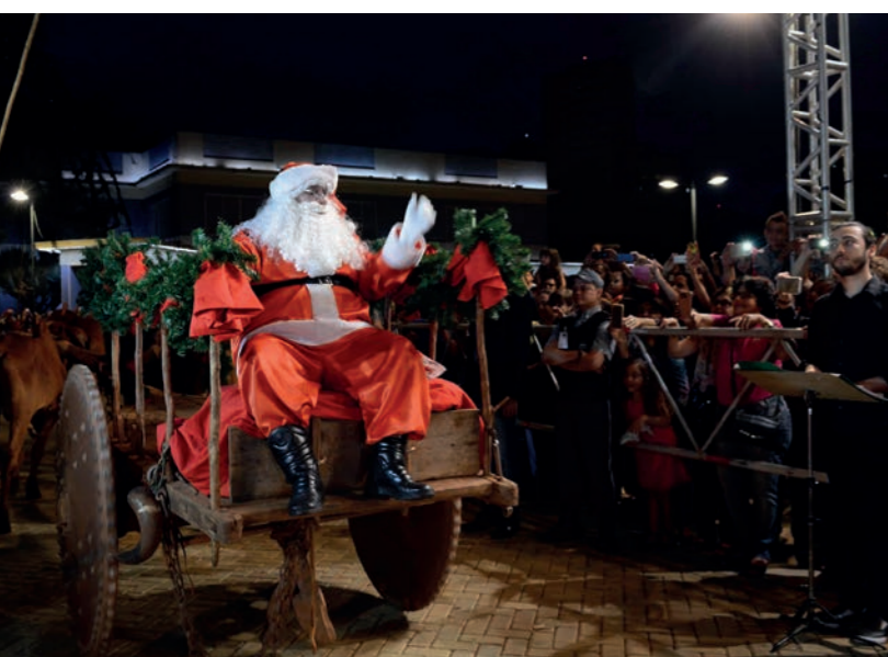
Valorização da cultura goiana em 2017: Papai Noel chegou de carro de boi.

Evento transforma a Praça Cívica em ponto de encontro das famílias goianas. Luzes e apresentações tornam especial o clima natalino.