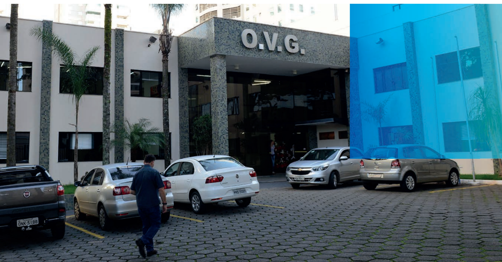
Fachada atual da Organização das Voluntárias de Goiás.