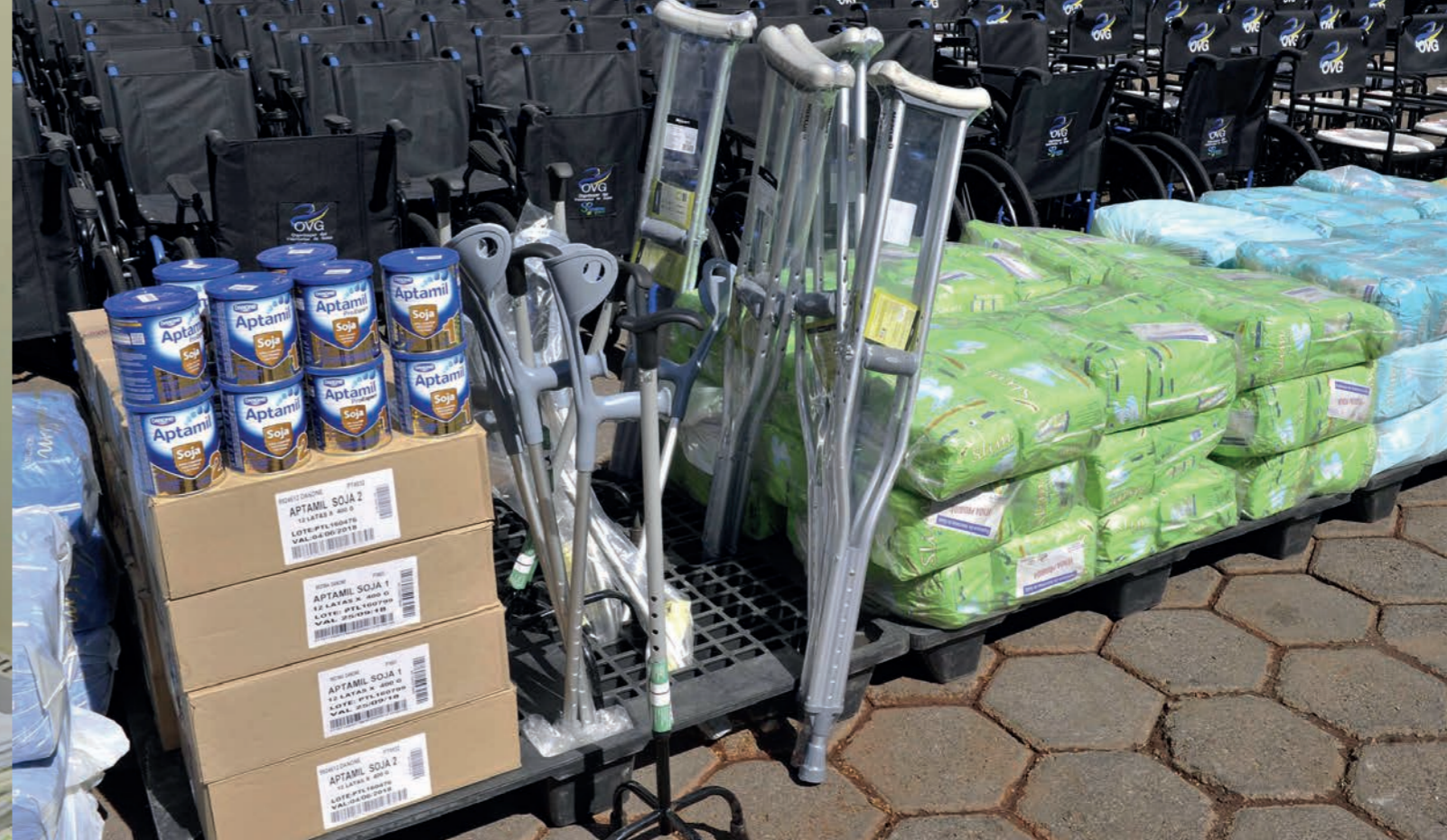
Benefícios doados pela OVG.

Grupo de mulheres católicas se reunia para a confecção dos benefícios e também de uniformes escolares e roupas de cama. Até hoje a OVG fabrica e distribui enxovais de bebês.