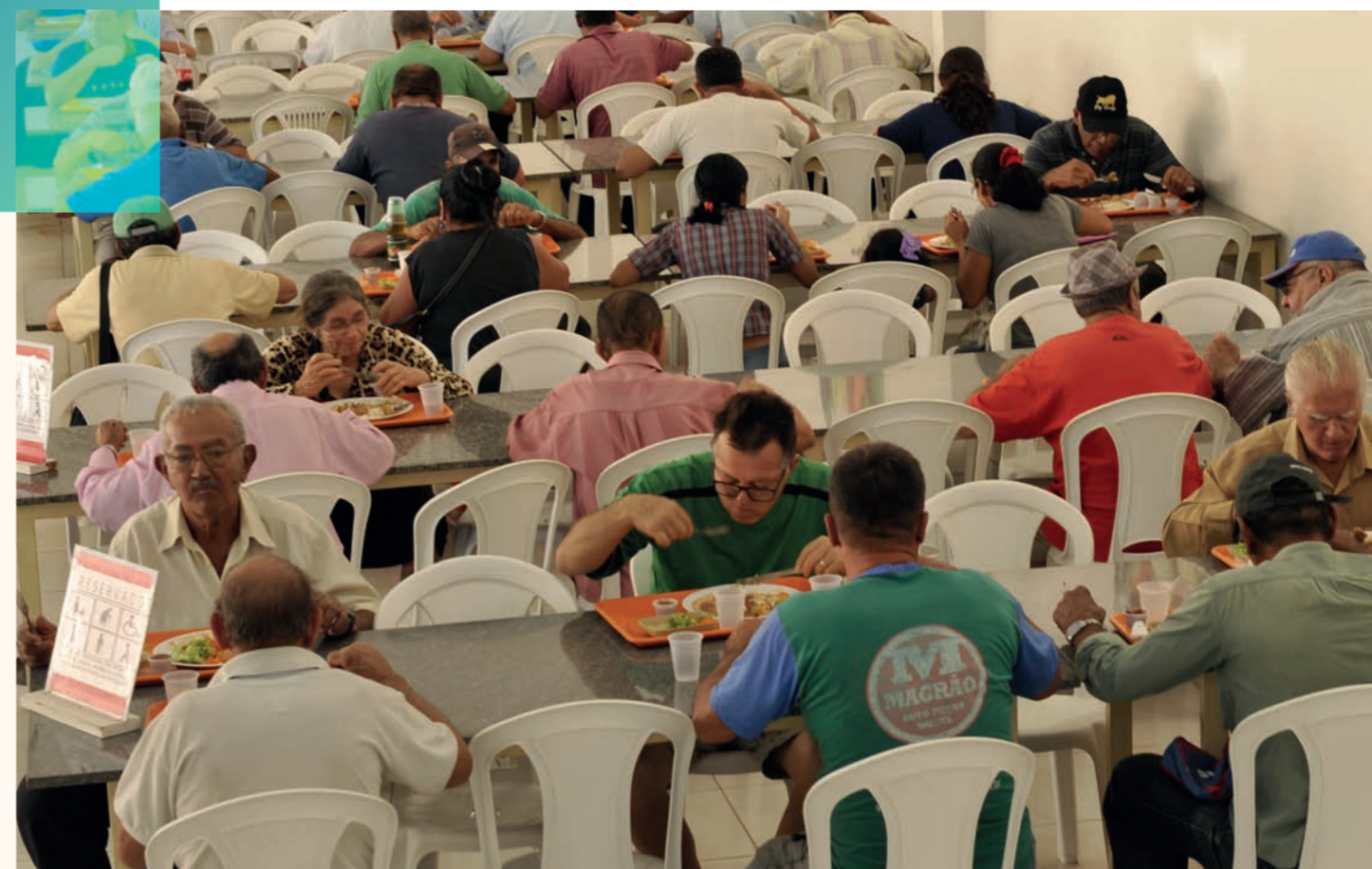
Restaurante Cidadão de Aparecida de Goiânia fica movimentado todos os dias.

O aposentado revela que não se cansa de olhar para os painéis que decoram o restaurante e que retratam a história de Campinas que tanto ama. São fotos de 1930, 1940 e 1950, que destacam o período áureo do setor. "Não poderia ter encontrado lugar melhor para almoçar. O atendimento é de primeira e o espaço nos acolhe com esse carinho. Acho bonita demais essa decoração. Me faz sentir bem aqui", revela.