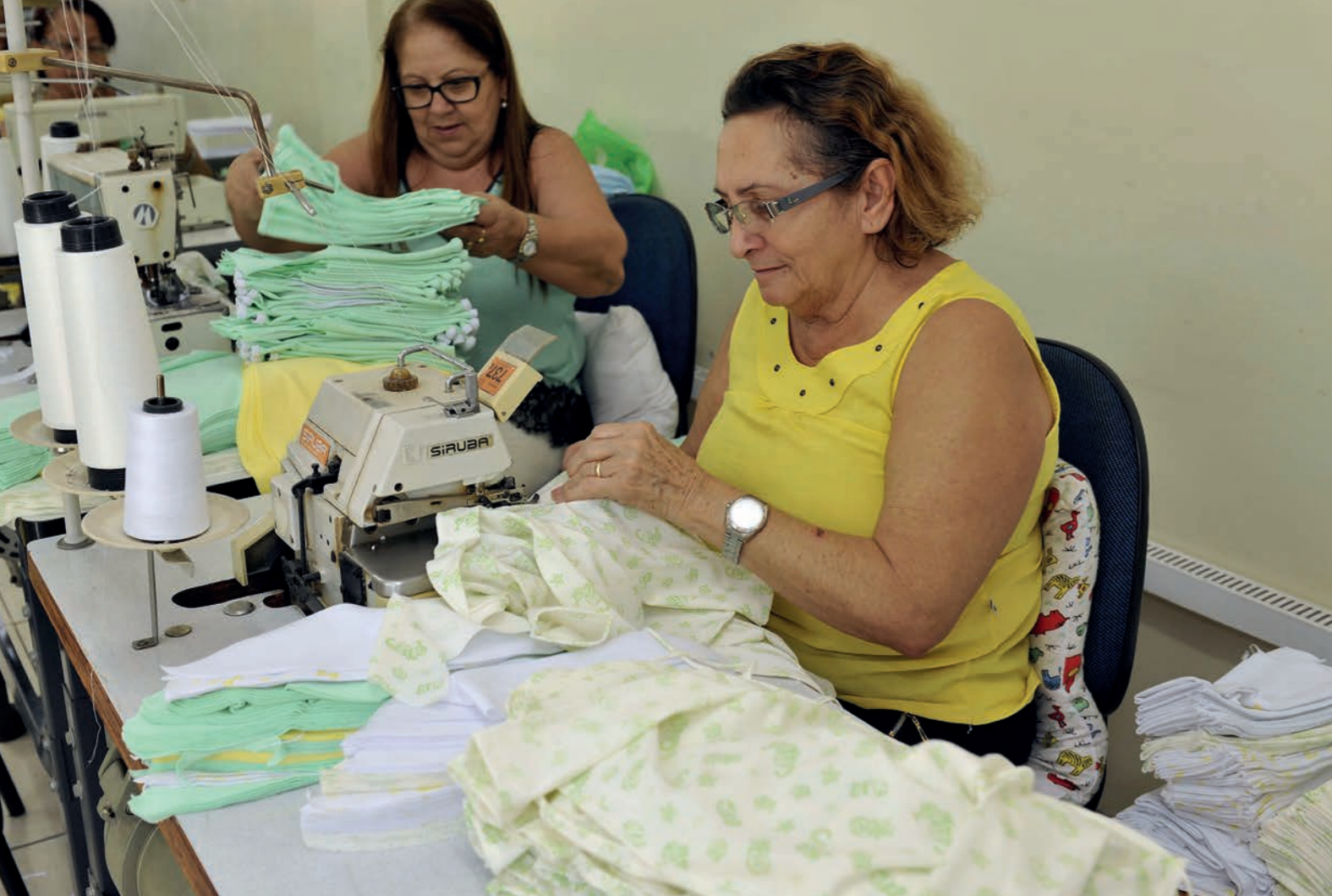
Costureiras na fabricação de enxovais para bebês.