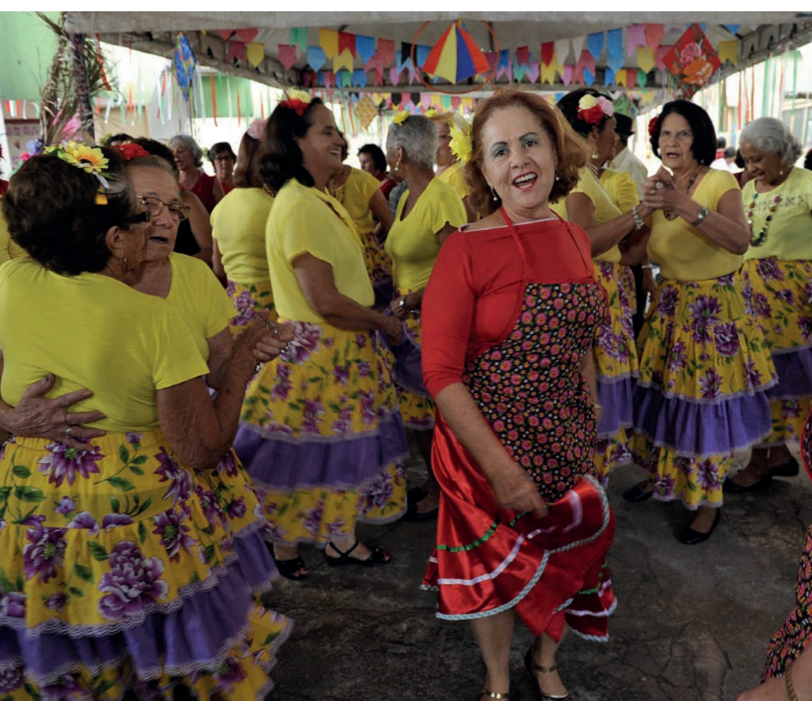
Grupo de dança do CCI Cândida de Moraes.