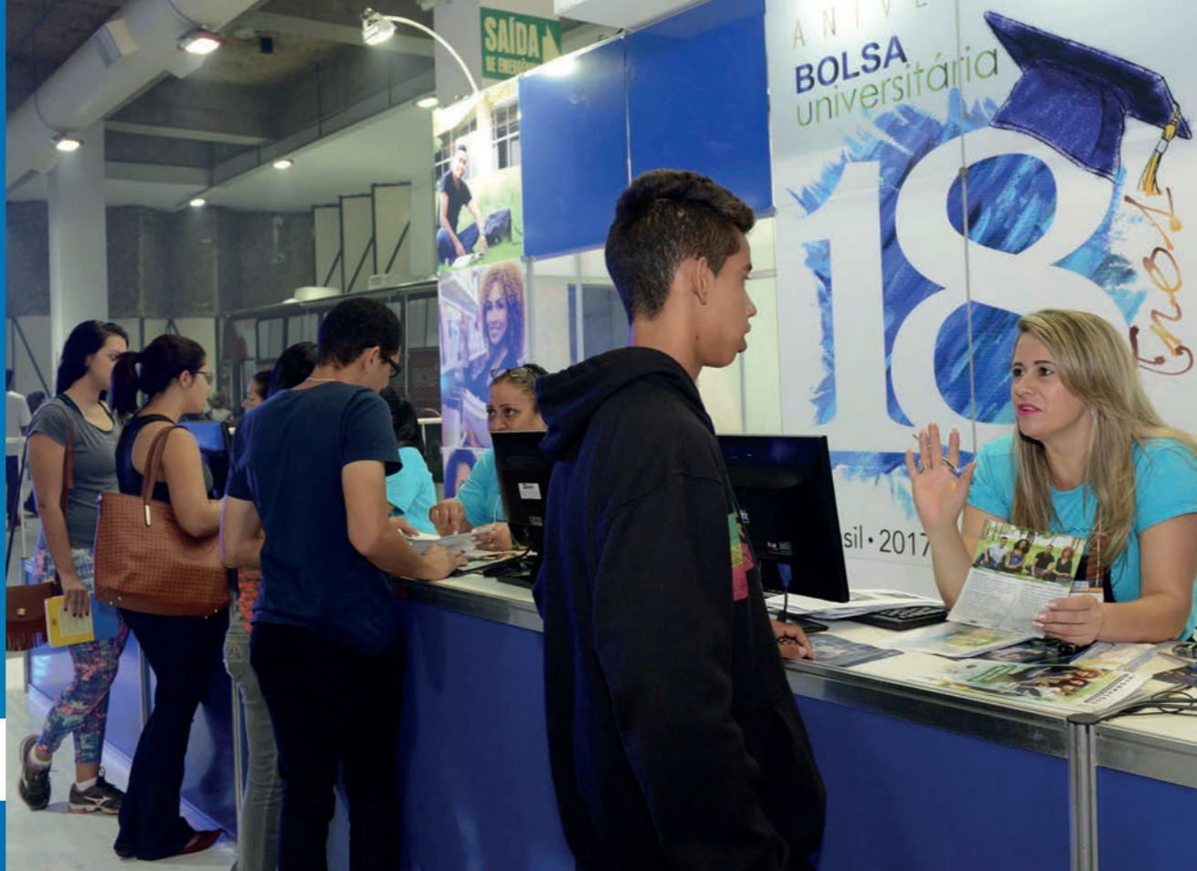
Expo CIEE leva informações e oferece oportunidades de estágio.

Em fevereiro de 2016, o CIEE, em parceria com a OVG, trouxe para Goiânia a 1ª Feira do Estudante - Expo CIEE Goiás, a maior feira do segmento no Brasil. A exposição é realizada há 20 anos em São Paulo. Na primeira edição em Goiás, atraiu um público de 23 mil pessoas e, em 2017, foi realizada a sua 2ª edição.