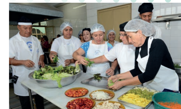
Aula de culinária na extinta Oficina Educacional Comunitária Cândida de Morais.

O Projeto Criança Cidadã foi implantado pela OVG, em parceria com a Agência Goiana de Habitação (AGEHAB), no ano de 2005, para a construção de Centros de Educação Infantil em vários municípios do Estado. A Organização construiu mais de 100 unidades junto com municípios e entidades filantrópicas. Em 2015, o projeto foi transferido definitivamente para AGEHAB.