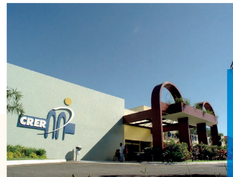
Centro de Reabilitação e Readaptação Dr. Henrique Santillo (CRER).

O hospital nasceu sob a gestão de uma Organização Social (OS), a AGIR, e é referência em reabilitação de pessoas com deficiência física, auditiva, visual e intelectual, atendendo exclusivamente pelo Sistema Único de Saúde (SUS). O CRER é de competência da Secretaria Estadual de Saúde.