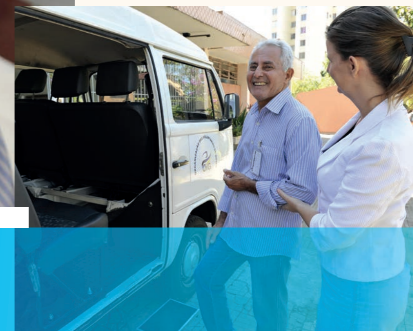
Cigo oferece transporte para os usuários.