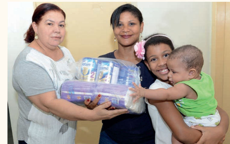
Mãe recebe fraldas e leite para o filho de 7 meses.

Os Centros de Referência em Assistência Social (CRAS), os Centros de Referência Especializados de Assistência Social (CREAS), as Secretarias Municipais de Assistência Social e Secretarias Municipais de Saúde fazem a ponte entre as prefeituras e a OVG, pois estão integrados no sistema de repasses de benefícios. Os interessados passam por triagem prévia, segundo critérios de atendimento, entre eles a renda familiar.