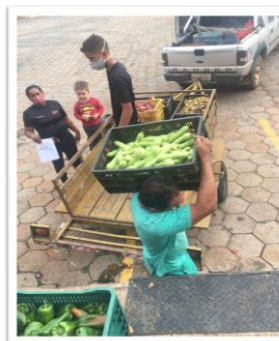
Alimentos distribuídos para as entidades.