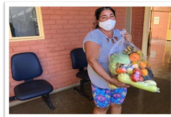
Distribuição para as famílias.