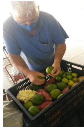
Distribuição para as famílias.