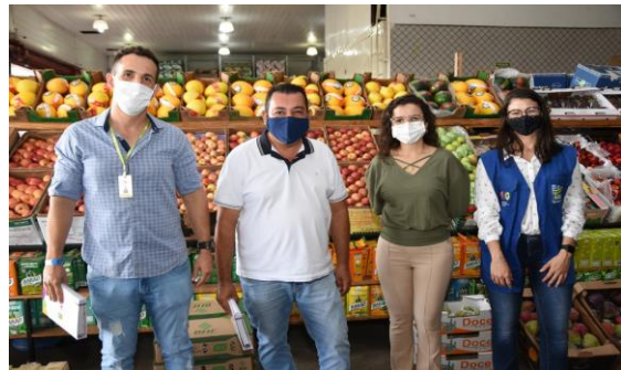
Visita e distribuição de agendas aos concessionários, permissionários e produtores da CEASA.