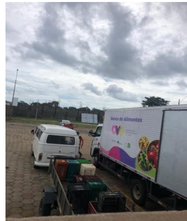
Distribuição para as entidades.