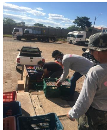
Distribuição para as entidades.