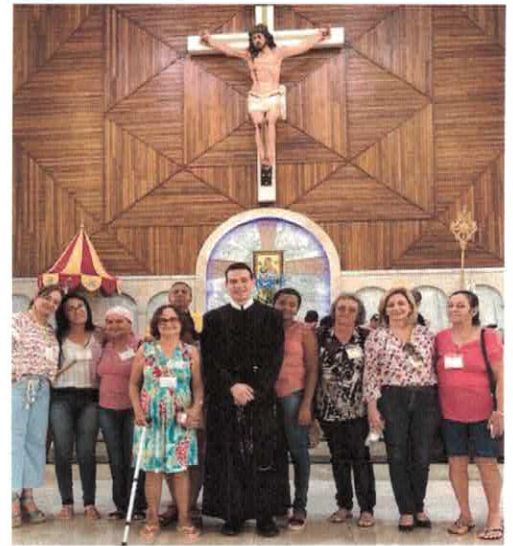
CIGO: Missa na Matriz de Campinas.