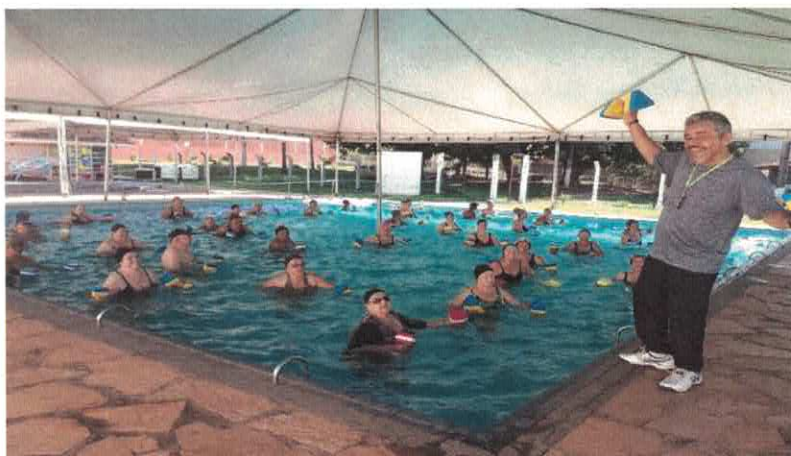
CISF: Atividade de Hidroginástica.

Handwritten signatures and marks in blue ink, including a stylized signature and several circular scribbles.