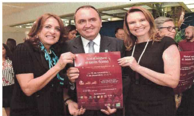
Lançamento da campanha Natal Seguro e Sem Fome.