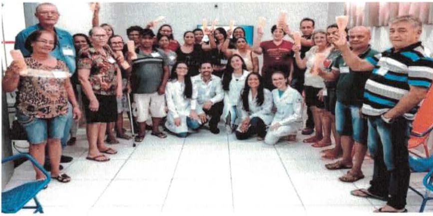
CIGO: Palestra sobre Atividade na 3ª Idade - Parceria com a Faculdade de Campinas (FAC).