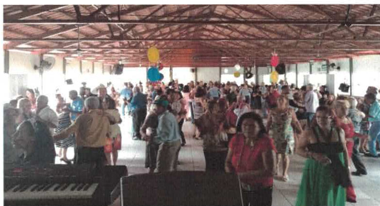
CIVV: Baile Mensal.