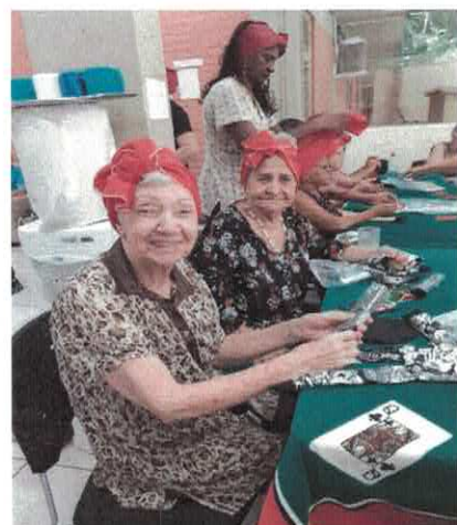
CISF: Dia da Consciência Negra.