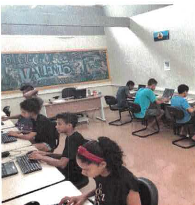
CATF: Jogos Online Educativos.