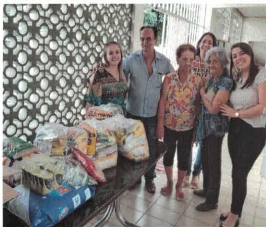
CIVV: Bolsistas/OVG - Donativos e cuidados de higiene e beleza para os idosos.