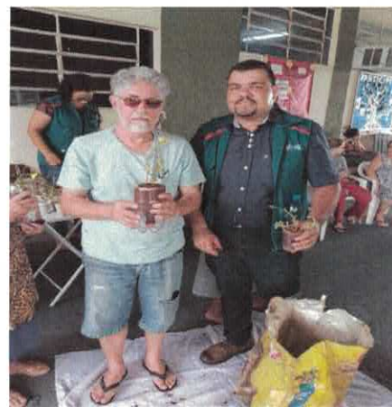
CIVV: AMMA - Materiais recicláveis e plantio de mudas.