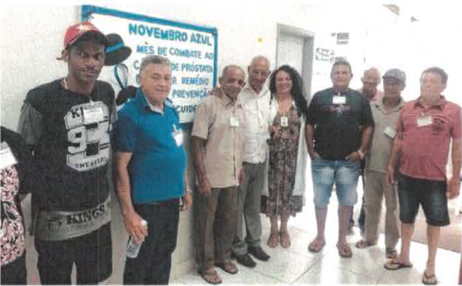
CIGO: Palestra com enfermeira sobre o Novembro Azul.