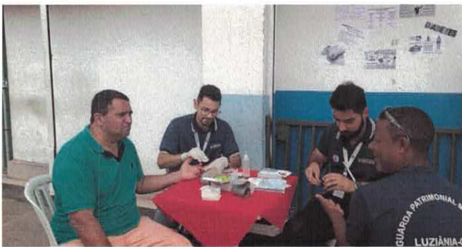
RB - Luziânia: Prevenção da Hipertensão e Diabetes.