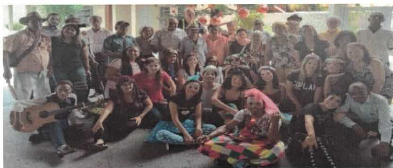
CIVV: Voluntários - Grupo Alegria.