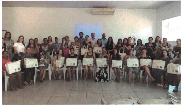
CSDGB e GVPS: Palestra em São Miguel do Araguaia com odontóloga e assistente social.