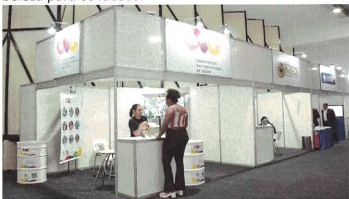
Sociedade Brasileira de Anestesiologia do Estado de Goiás: Ação solidária em prol da OVG.