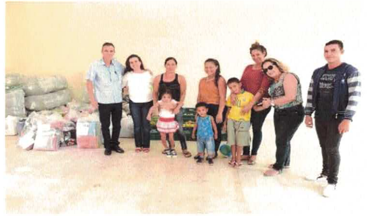
GVPS: Entrega de benefícios às famílias venezuelanas na OSCEIA.