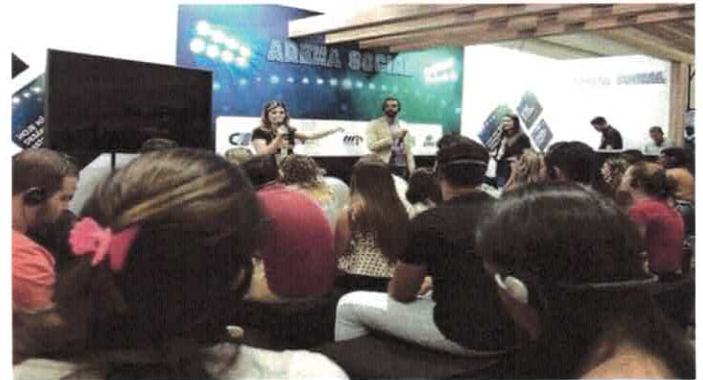
GVPS: Palestra sobre a Plataforma do Voluntariado na Expo CIEE.