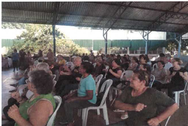
EBV II: Festa da Família.