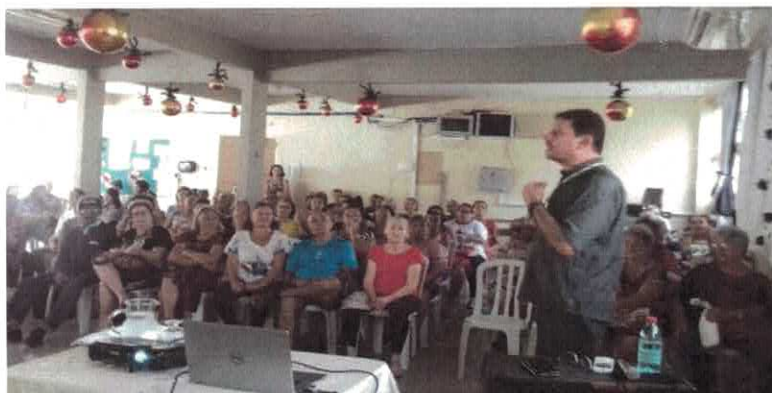
EBV I: Palestra com tema Novembro Azul.