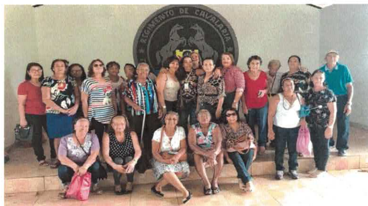
EBV I: Passeio no Batalhão da Cavalaria.