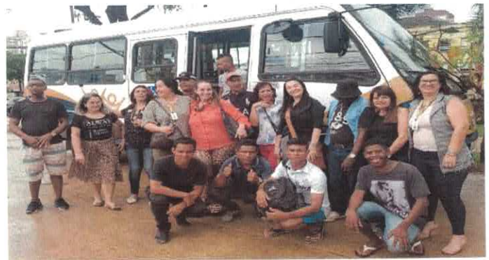
RB: Parceria OVG e SEMAS - Centro Pop.