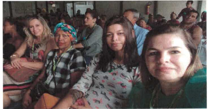
Almoço celebração do Dia da Consciência Negra - Parceria entre as unidades VILA VIDA, EBV II, CIGO e CSDGB.