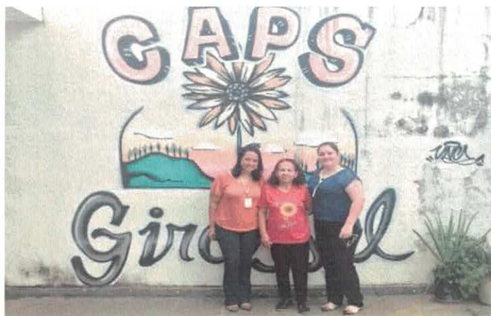
CATF: Visita Institucional no CAPS Girassol.