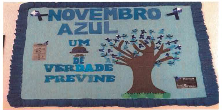
RB - Águas Lindas: Mural Novembro Azul.