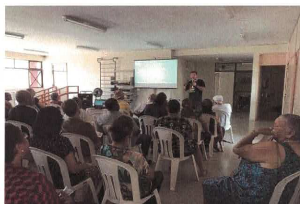
CISF: Palestra Novembro Azul.