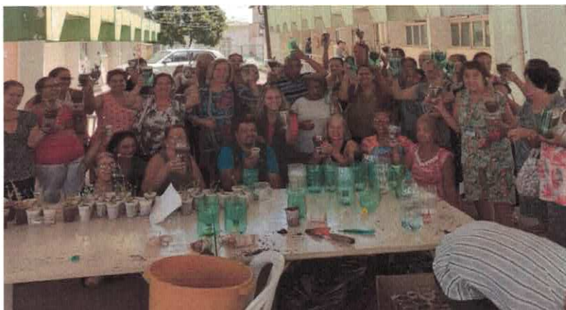
EBV I: Parceria com AMMA - Plantio de Mudas.