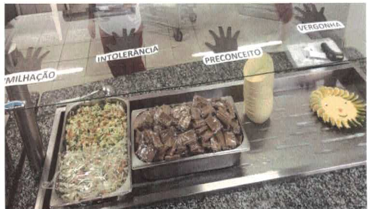
RB - Anápolis. Cardápio Especial no Dia da Consciência Negra.