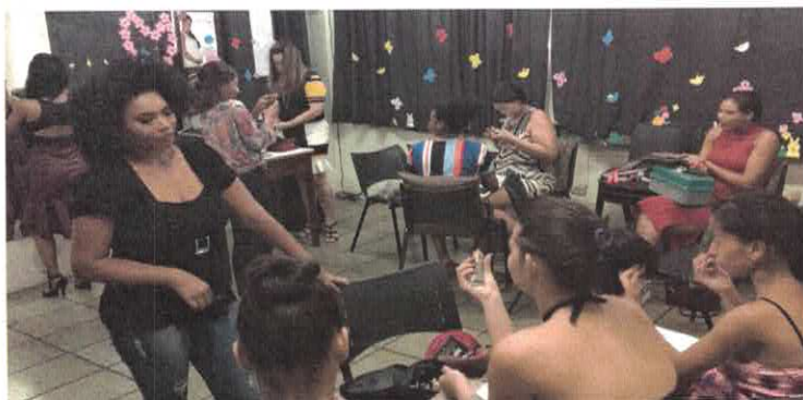
CSDGB: Curso de automaqüagem, iniciativa da instrutora em parceria com voluntárias.