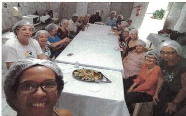
EBV II: Cozinha Terapêutica.