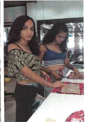
CATF: Curso de Modelagem, Corte e Costura.