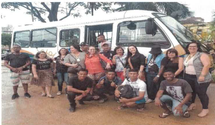
RB - Goiânia: Ação social OVG e SEMAS / Centro POP.