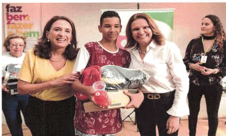
CATF: Parceria OVG, GMAG e TJ-GO.