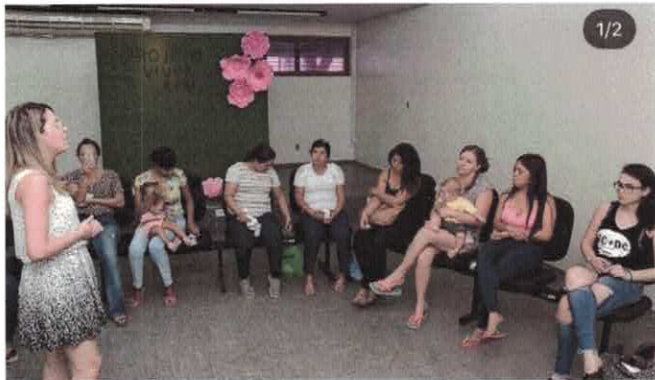
GVPS: Projeto Viver Bem - Roda de conversa com mães de beneficiários.