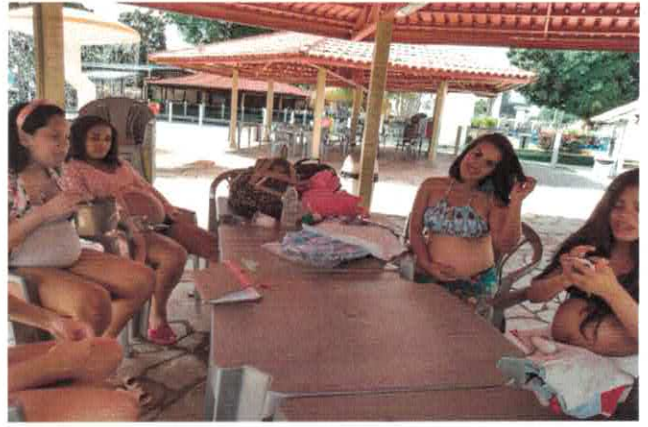
CSDGB: Passeio ao clube.