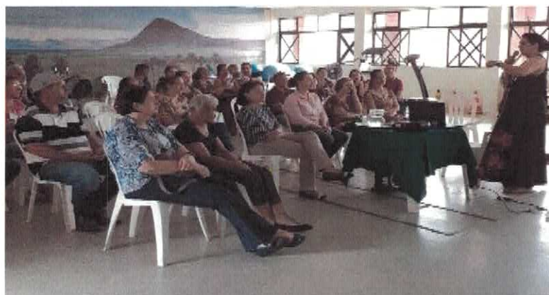
CISF: Reunião Familiar.