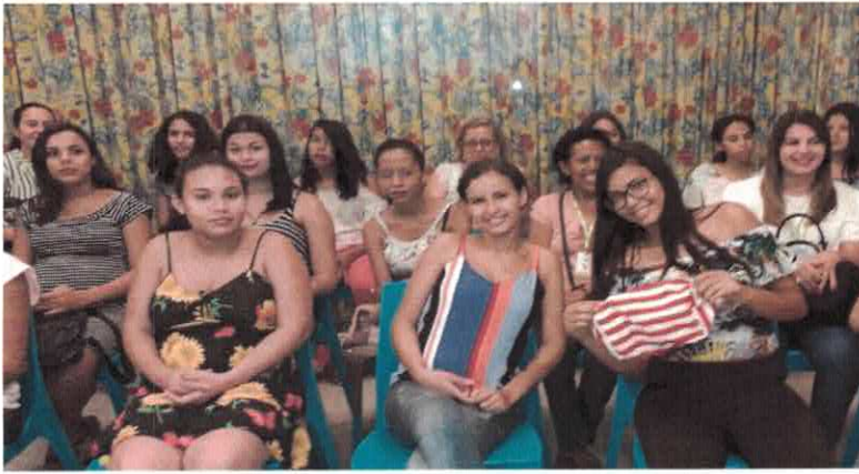
CSDGB: Adolescentes no Clube da Costura do Mega Moda.