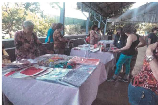
EBV II: Feira de Talentos.