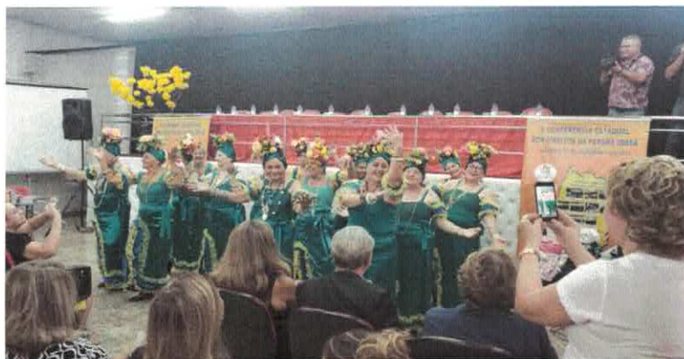
EBV II: Arte e Inclusão na V Conferência Estadual dos Direitos da Pessoa Idosa.