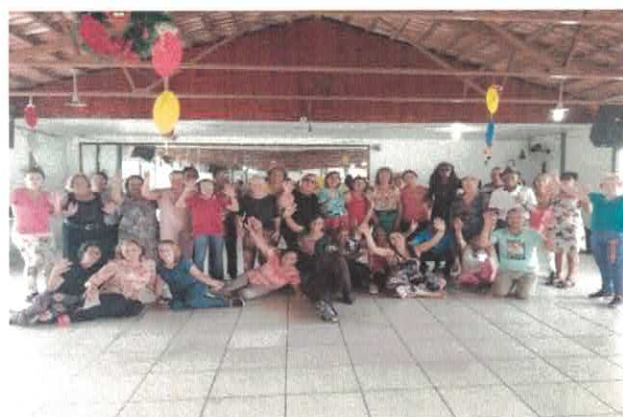
CIVV: Grupo de Dança Fitness.