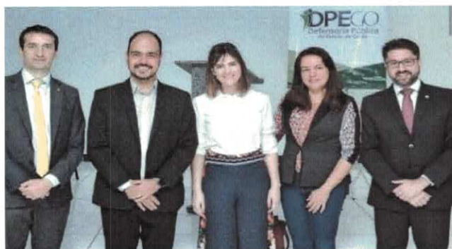
GVPS: Parceria com a DPE em Trindade.