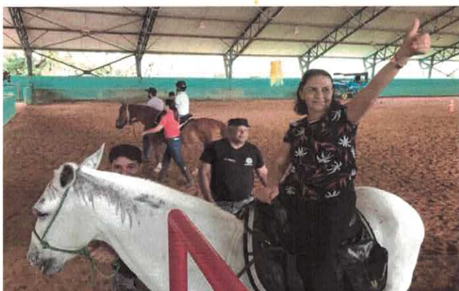
EBV I: Passeio no Batalhão da Cavalaria.