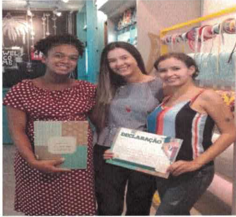
CSDGB: Conclusão do curso de Corte e Costura.