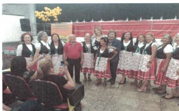
EBV I: Conferência Estadual da Pessoa Idosa.