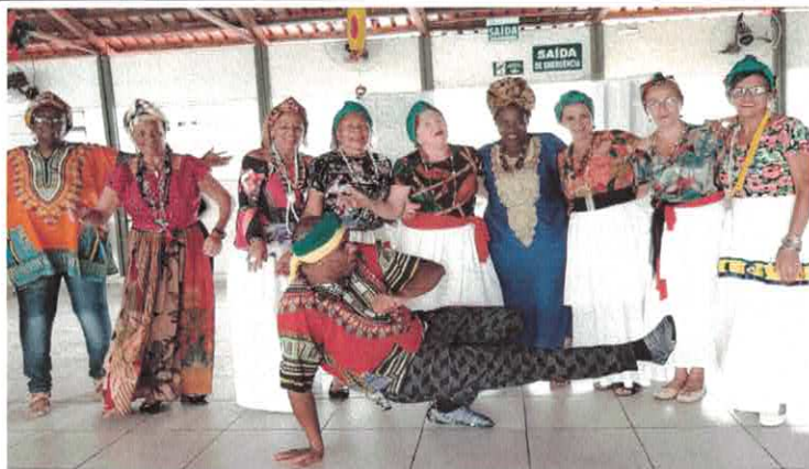
CIVV: Dia da Consciência Negra.