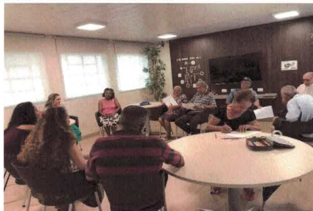
CIVV: Grupo de Psicologia - Relaxamento e Bem-estar.