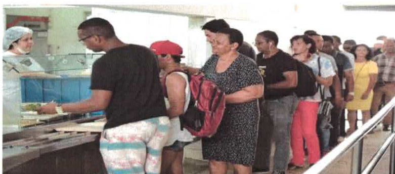
RB: Parceria OVG e SEMAS para atender pessoas em situação de rua.