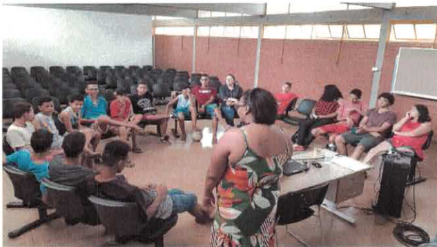
CATF: Projeto Profissionais do Futuro e Dia da Consciência Negra.