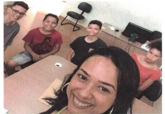
CATF: Grupo do Serviço Social.