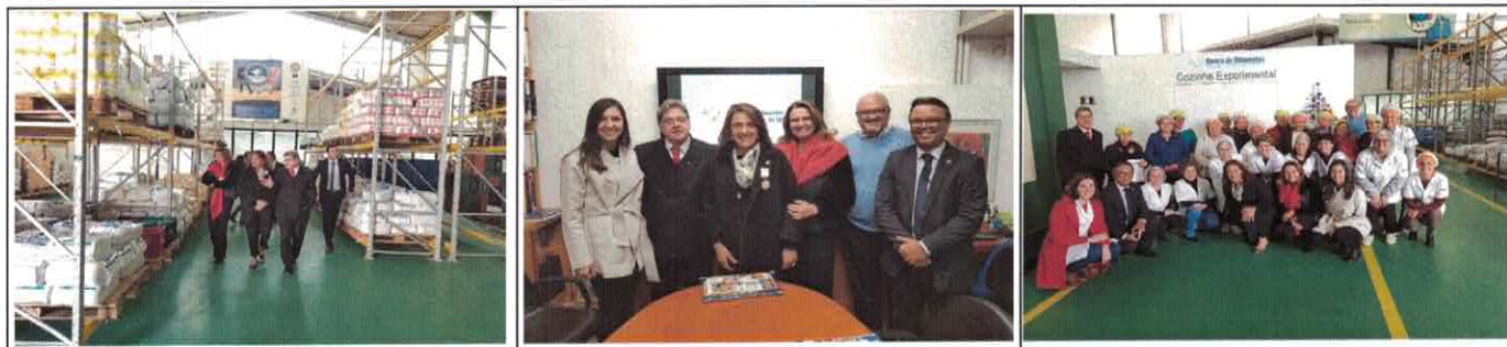
Visita ao Banco de Alimentos em Porto Alegre/RS