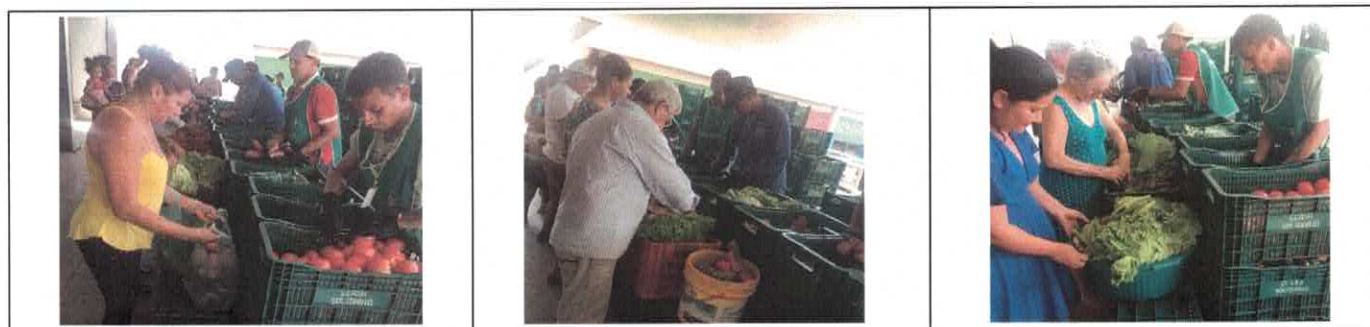
Distribuição para famílias