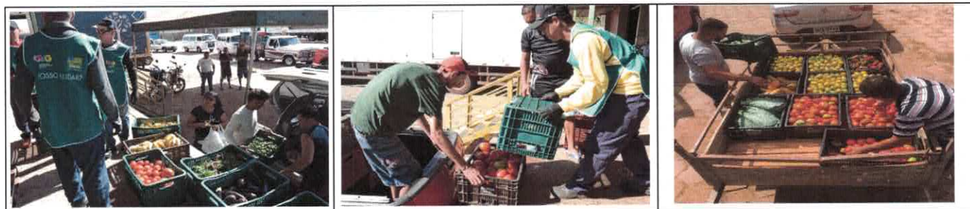
Distribuição para entidades e orientações quanto ao transporte de alimentos