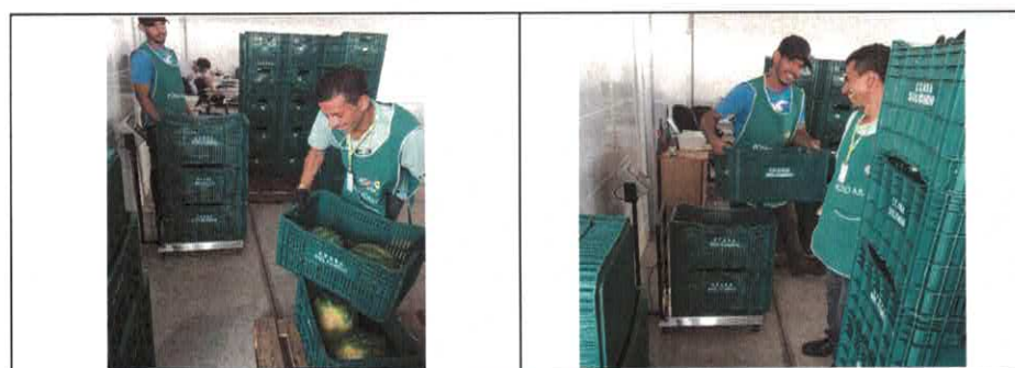
Pesagem dos alimentos para controle de entrada e saída