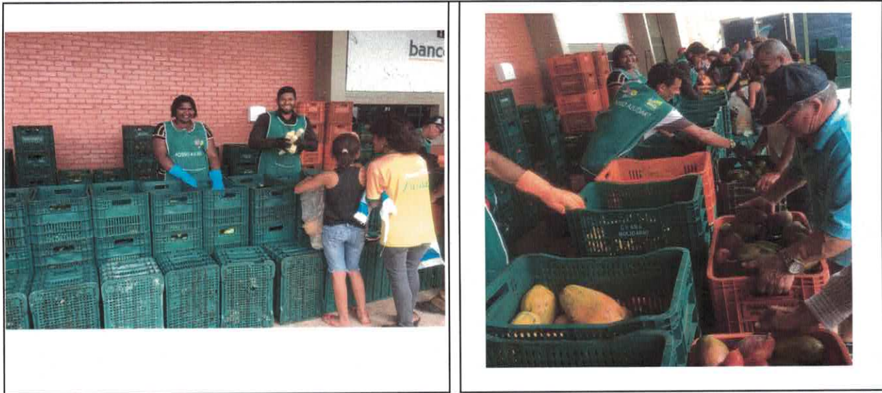
Distribuição para famílias