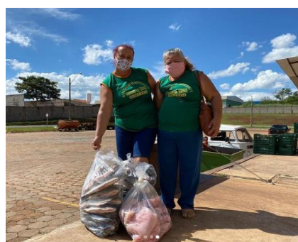
Doação de Peixes para entidades cadastradas.