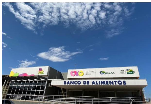
Instalação da fachada para identificação do Banco de Alimentos.