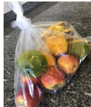
Entrega de kits com frutas para população em situação de rua.