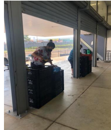
Distribuição para as famílias.