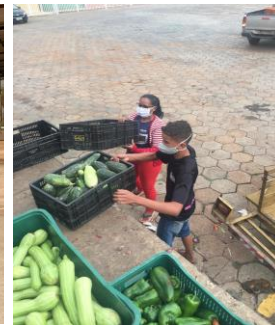
Distribuição para as entidades.