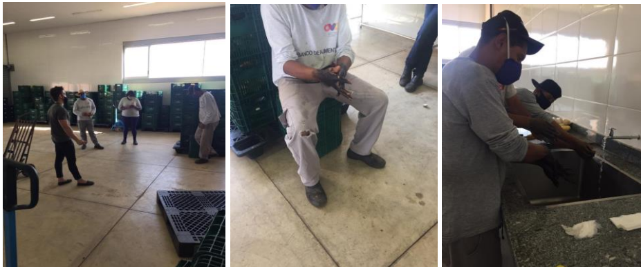
Capacitação para Colaboradores: Higienização das Mãos.