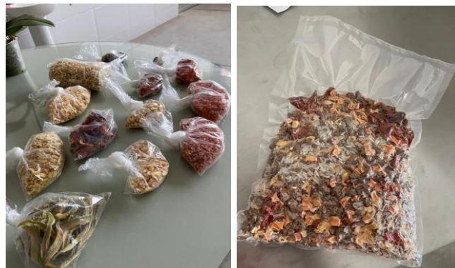
Testes para MIX DO BEM.