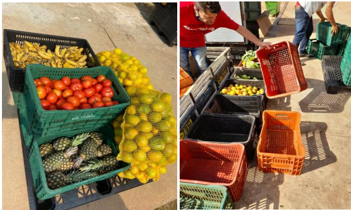
Distribuição para as entidades.