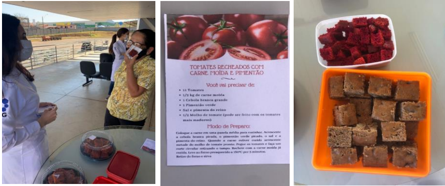
Atividades de Educação Alimentar e Nutricional: Aproveitamento Integral dos Alimentos.