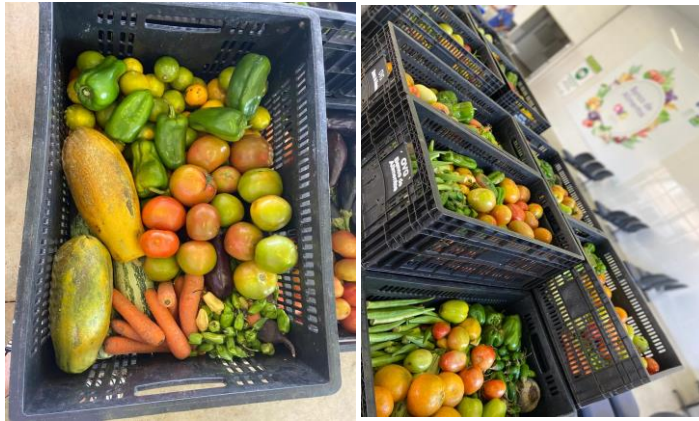
Distribuição para as famílias.