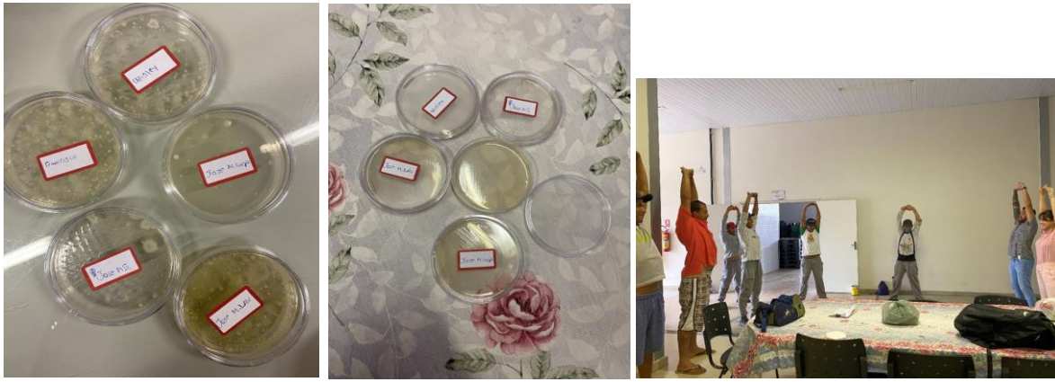
Capacitação para Colaboradores: Higienização das Mãos e Atividade Laboral.