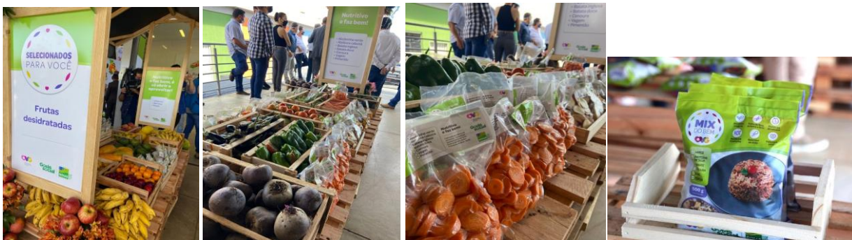
Lançamento do Programa NutreBem.