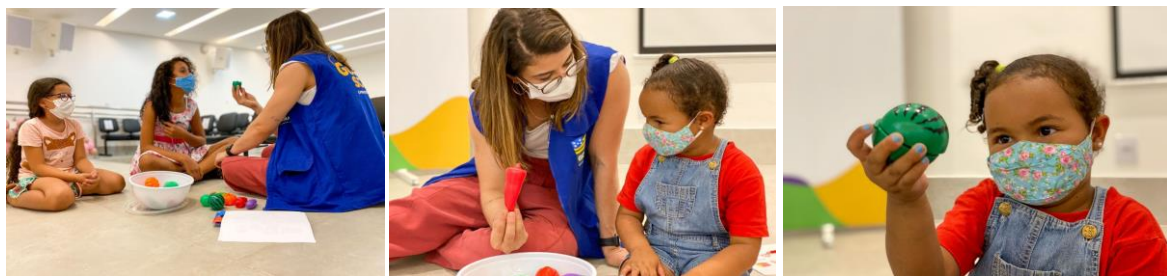
Ação Dia das Crianças.