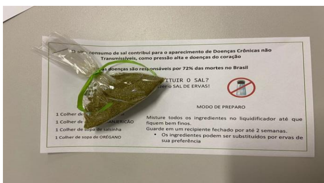
Capacitação para Famílias e Entidades Sociais: Combate à Hipertensão e distribuição do sal de ervas.