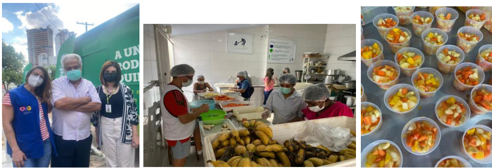
Ação Tio Cleobaldo: Produção e Entrega de Saladas de Frutas.