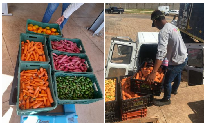
Distribuição para as entidades.