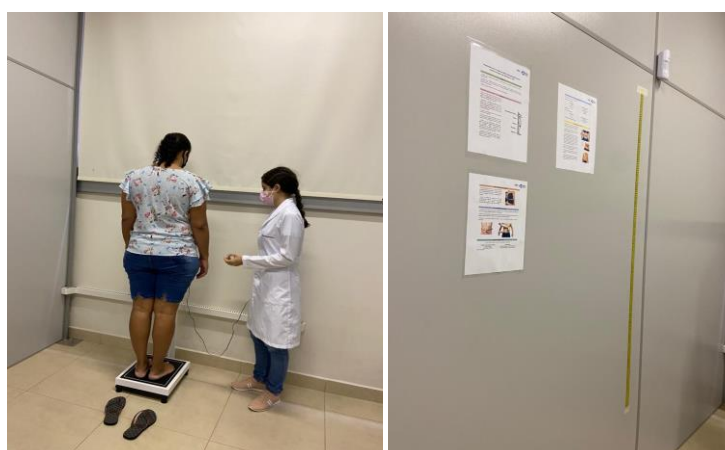
Avaliação nutricional dos beneficiários.