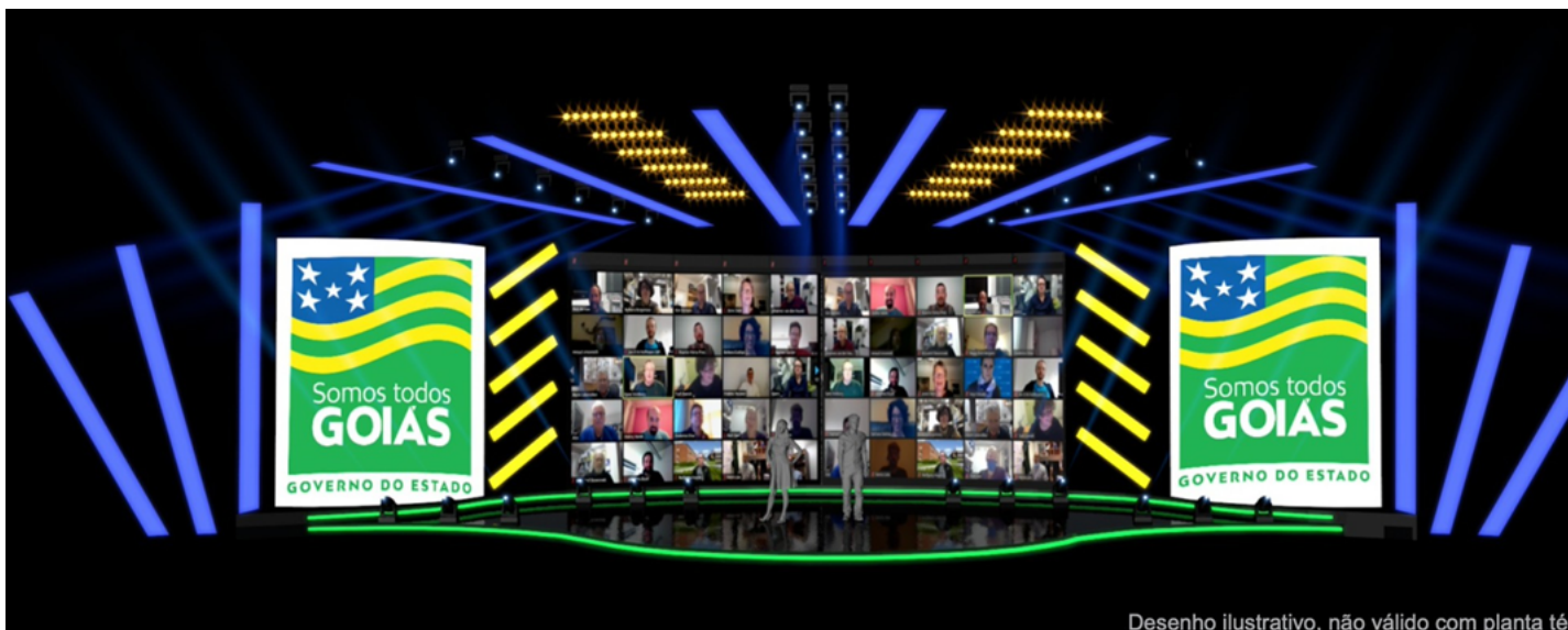
Desenho ilustrativo, não válido com planta técnica