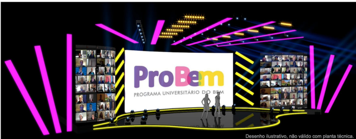
Desenho ilustrativo, não válido com planta técnica.