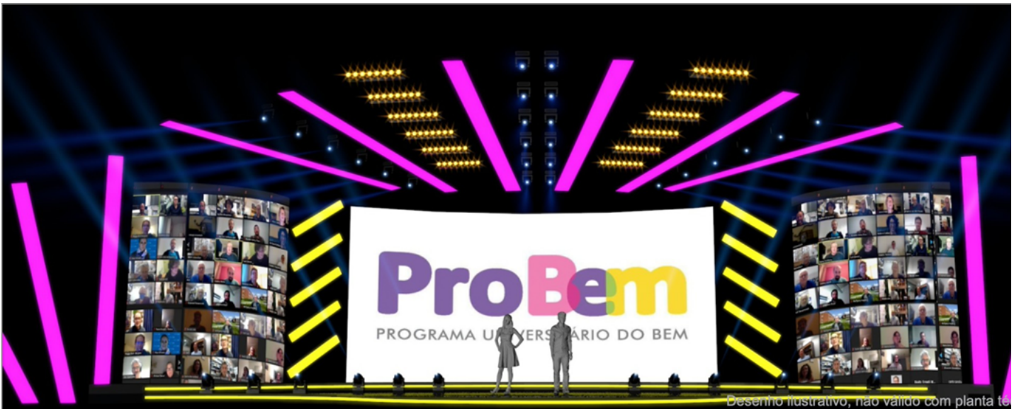
Desenho ilustrativo, não válido com planta técnica.