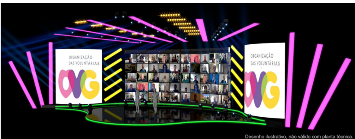
Desenho ilustrativo, não válido com planta técnica.