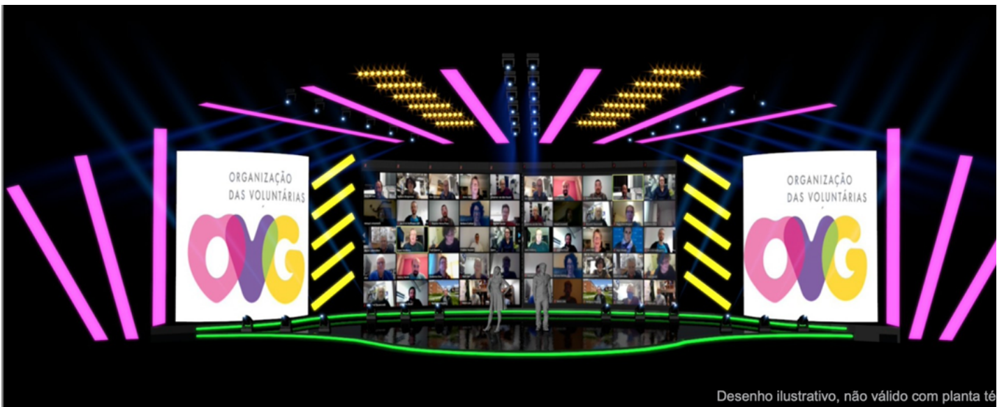
Desenho ilustrativo, não válido com planta técnica