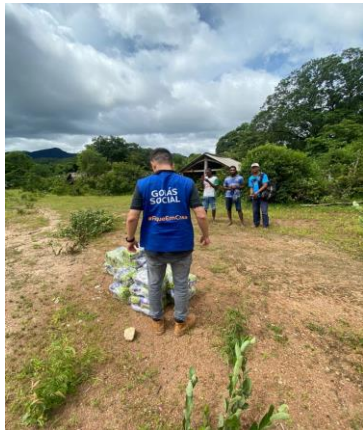
Entrega do Mix do Bem e desidratados para famílias do nordeste goiano.