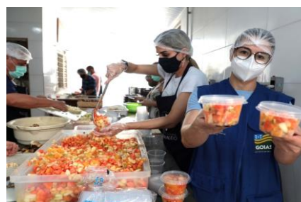
Produção de saladas de frutas para pessoas em situação de rua.