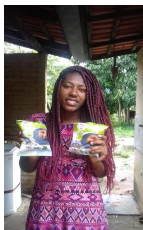
Distribuição para as famílias.