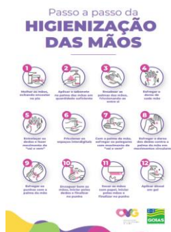
Capacitação sobre higienização das mãos.