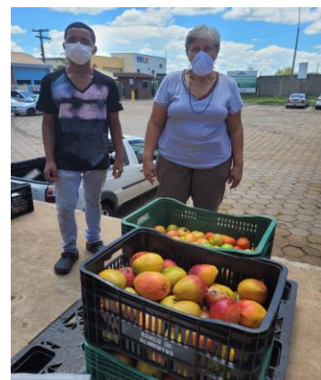
Distribuição para as entidades.