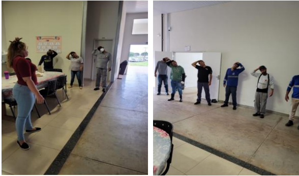
Capacitação para Colaboradores: Ginástica Laboral