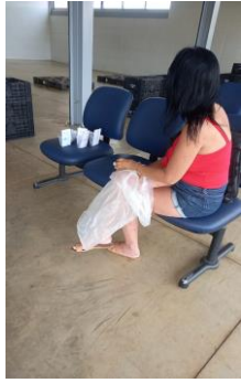
Capacitação: Coleta Seletiva