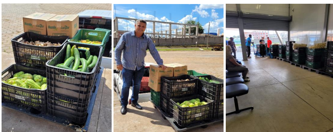
Distribuição para as entidades.