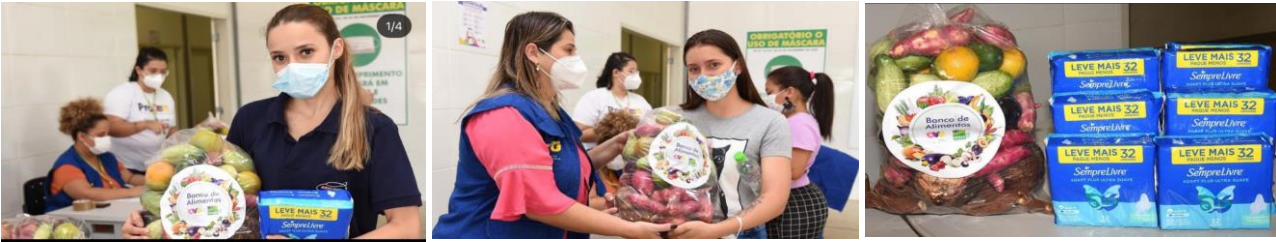
Entrega de cestas de hortifrutis e absorventes aos beneficiários do ProBem