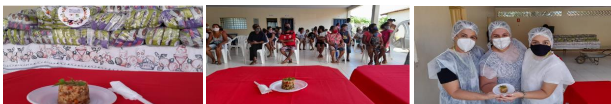
Entrega de desidratados para beneficiários e capacitação.