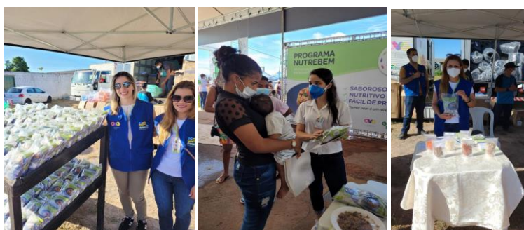
Entrega dos desidratados nas ações do OVG Perto de Você e Mutirão Governo de Goiás.