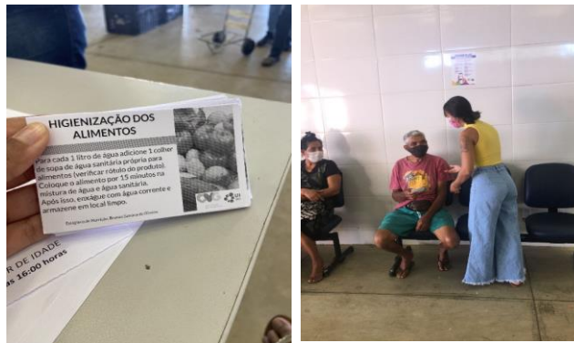
Capacitação: Higienização das mãos e alimentos.