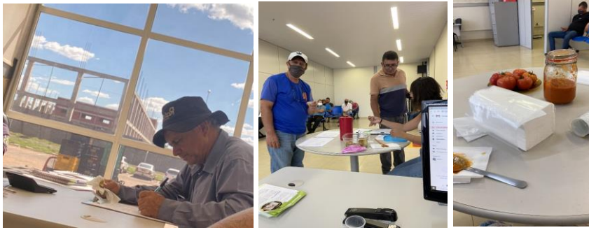
Capacitação: Aproveitamento integral dos alimentos com degustação de receitas.