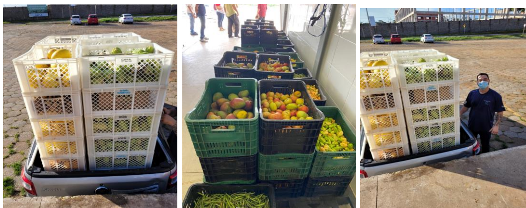
Distribuição para as entidades.