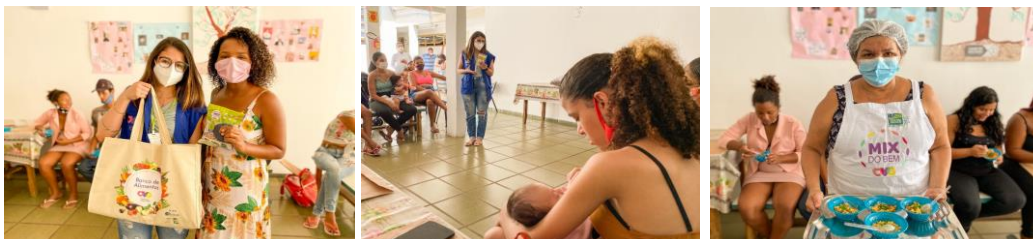
Dia Nacional da Saúde e Nutrição é celebrado com atividades no Programa Meninas de Luz.