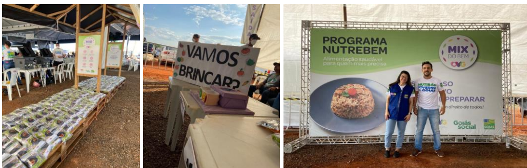
Entrega de Desidratados no Mutirão Social do Setor Vera Cruz