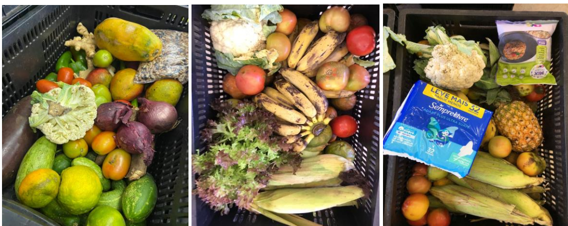
Distribuição para Famílias