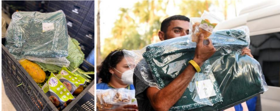
Distribuição de cobertores da campanha "Aquecendo Vidas"