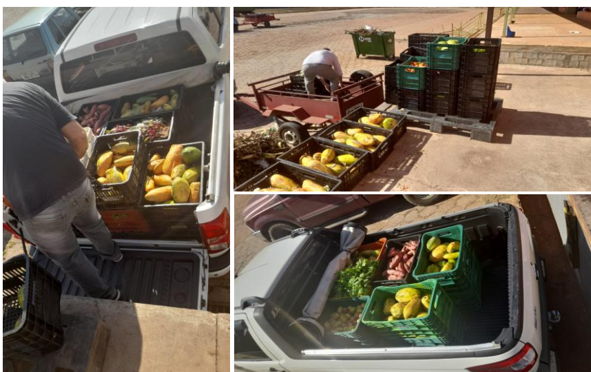
Distribuição para Entidades Sociais