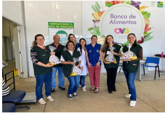
Visita dos Técnicos da Fundação Cargill