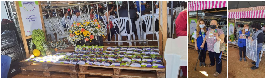
Entrega do Mix do Bem no OVG Perto de Você