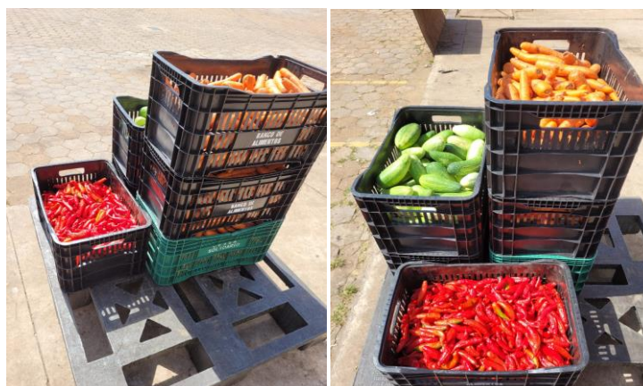
Distribuição para Entidades Sociais.