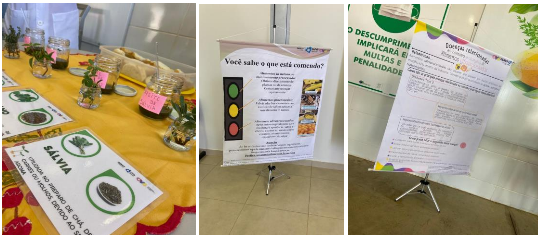
Capacitação para Famílias e Entidades sobre aproveitamento integral dos alimentos; alimentos ultraprocessados; e doenças crônicas.