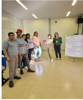
Capacitação continuada com os colaboradores.