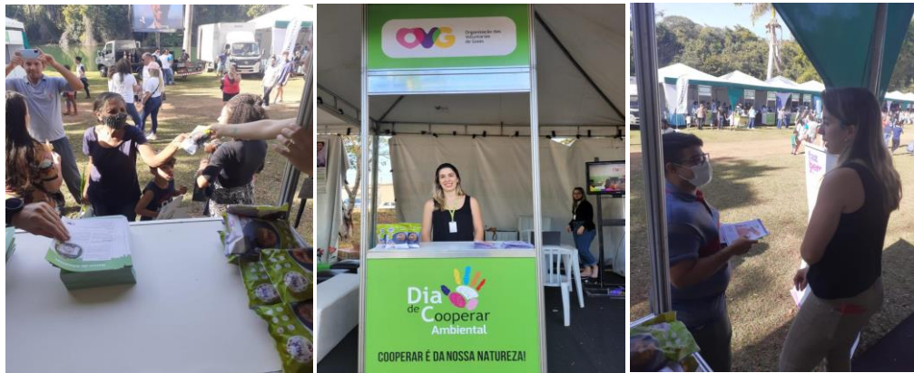
Dia C de Cooperar.