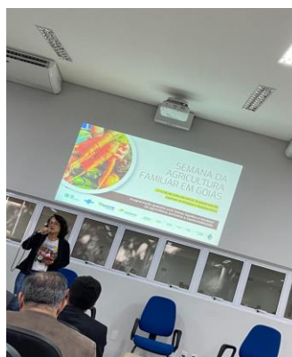
Semana da Agricultura Familiar em Goiás.