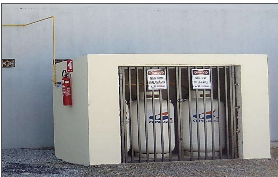
Central de gás GLP

O fornecimento e instalação de CENTRAL DE GÁS, bem como das tubulações de abastecimento até os pontos solicitados, serão executadas de acordo com a previsão de pontos indicados no projeto arquitetônico e de acordo com as demandas, dimensionamento e especificações técnicas do projeto elaborado pelo engenheiro projetista contratado. Para fins de garantia do sistema de abastecimento a ser instalado, deverá ser apresentado projeto com especificações dos itens componentes e que equipamentos constituintes sejam certificados pelo INMETRO assim como a apresentação da Anotação de Responsabilidade Técnica (ART) do engenheiro responsável. Deverá à empresa executora fornecer garantia, treinamento e manutenção preventiva e corretiva do sistema. Abaixo foto de exemplo Central de gás GLP.