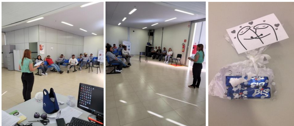
Capacitação continuada com os colaboradores.