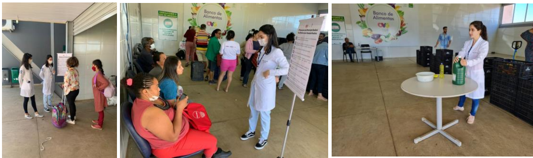
Capacitação para Famílias e Entidades sobre aproveitamento integral dos alimentos e os 10 passos para uma alimentação saudável.