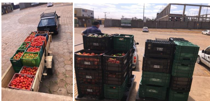
Distribuição para Entidades Sociais.