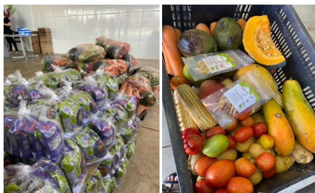
Entrega de alimentos processados junto aos in natura .