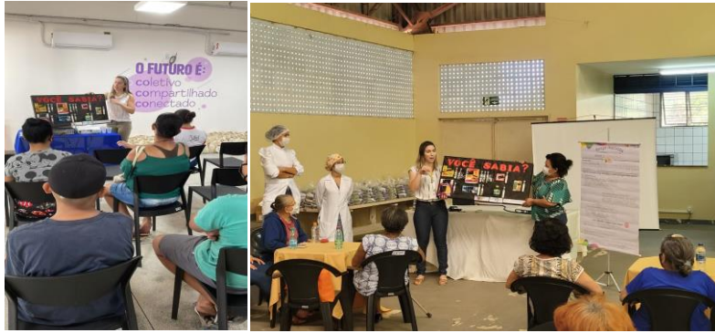
Capacitação e entrega do Mix do Bem aos adolescentes do Centro da Juventude Tecendo o Futuro e aos idosos do Sagrada Família.