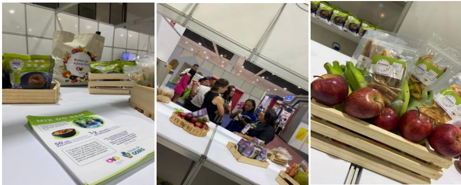
Exposição na Feira Super Agos.