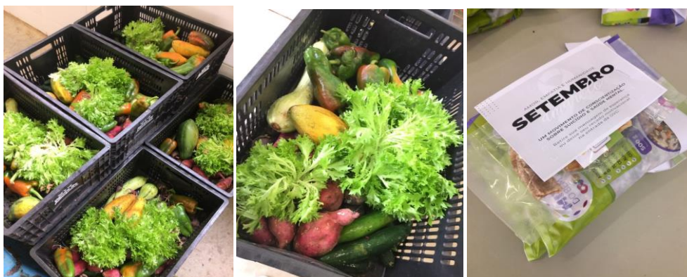
Distribuição para Famílias.