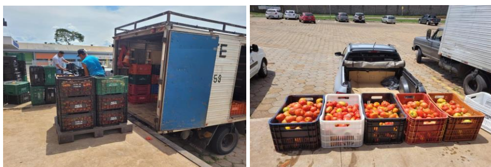
Distribuição para Entidades Sociais.