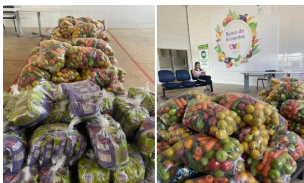
Entrega de alimentos processados junto aos in natura .