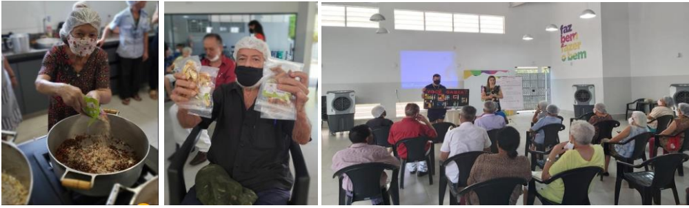
Capacitação e entrega do Mix do Bem para os Idosos da Vila Vida.