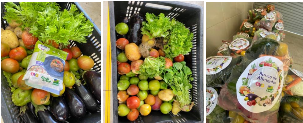
Distribuição para Famílias.