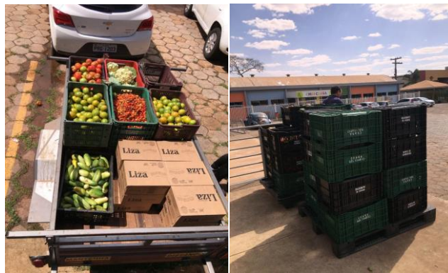
Distribuição para Entidades Sociais.