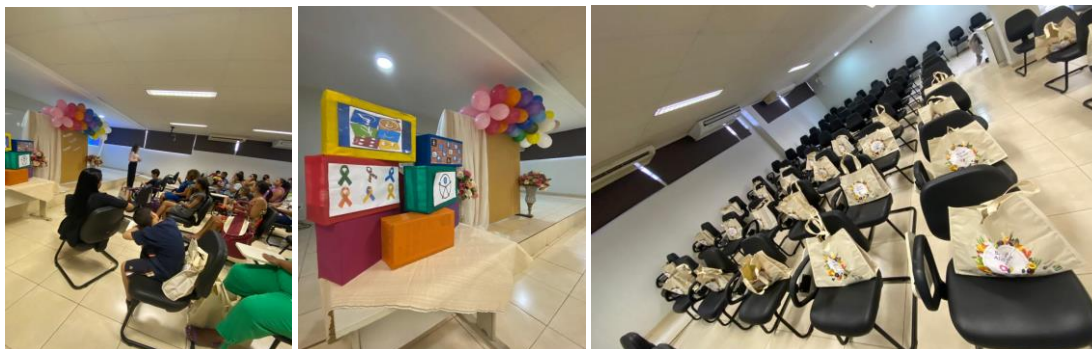
Capacitação para famílias e entidades.