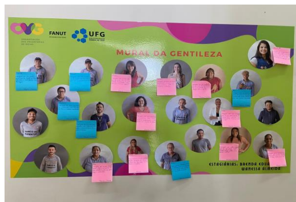
Mural da Gentileza.