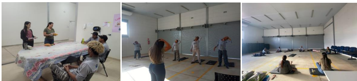
Capacitação para colaboradores: Padronização de cestas e realização de ginástica laboral e meditação guiada.