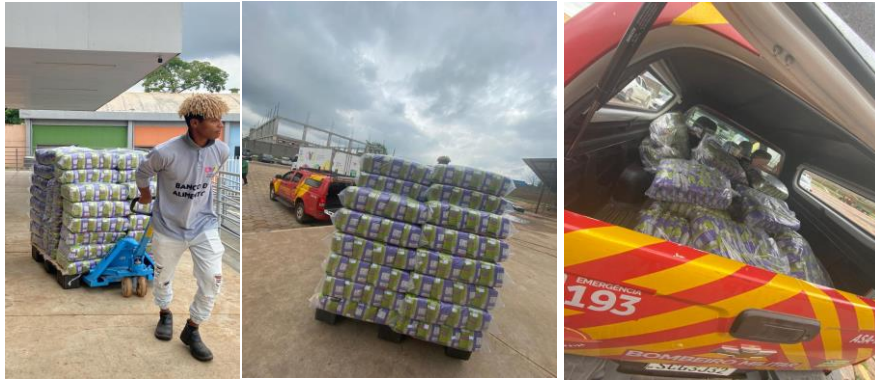
Produção e Saída de Mix do Bem para Operação Nordeste Solidário.