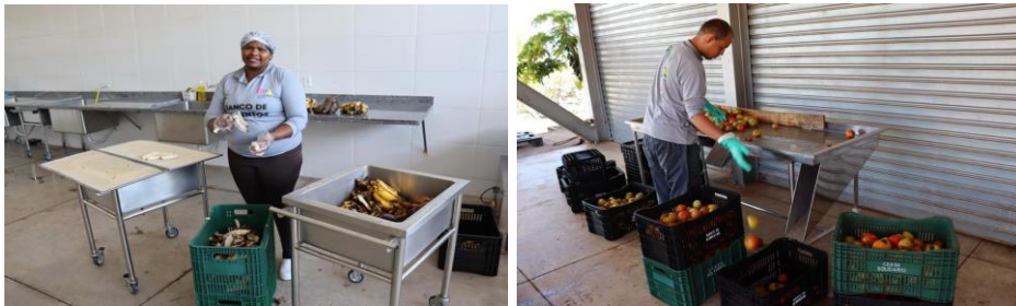
Capacitação para colaboradores: Higienização dos equipamentos de uso contínuo.