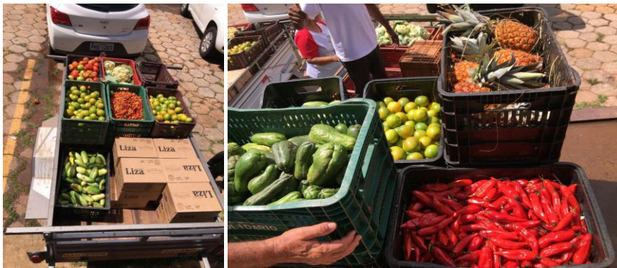
Distribuição para Entidades Sociais.