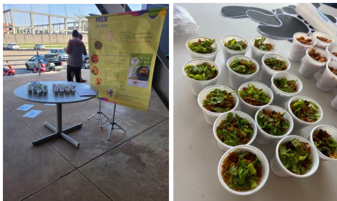
Dia Mundial da Alimentação Saudável - Degustação e entrega de receitas com Mix do Bem.