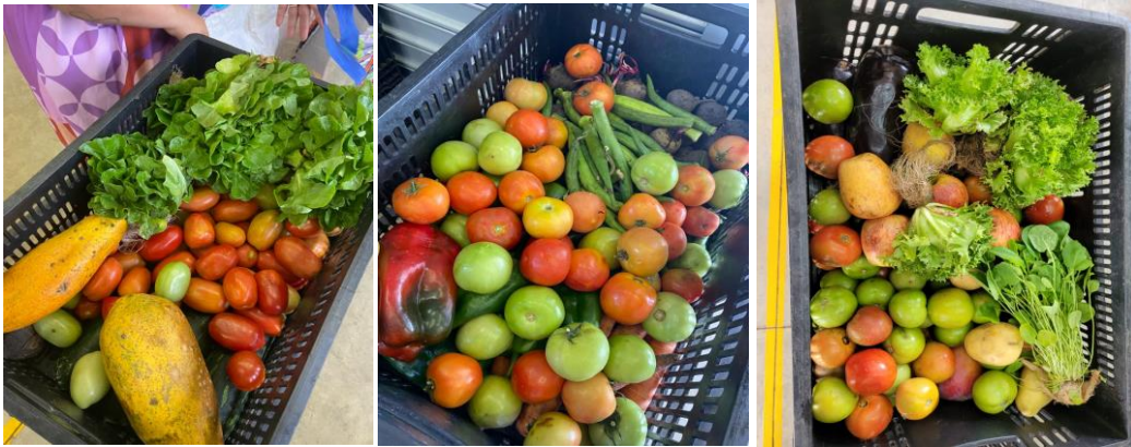
Distribuição para Famílias.