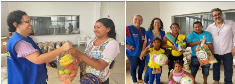
Entrega de cestas in natura, Mix do Bem e frutas desidratadas para famílias venezuelanas.