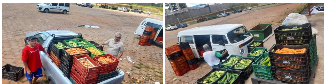
Distribuição para Entidades Sociais.