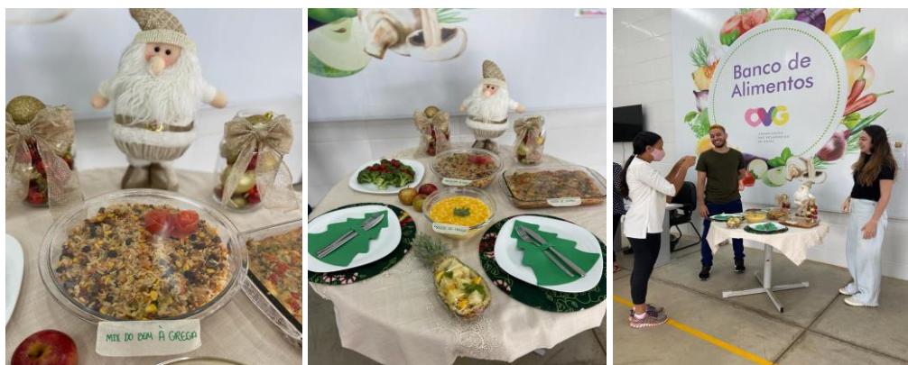
Capacitação para famílias e entidades.