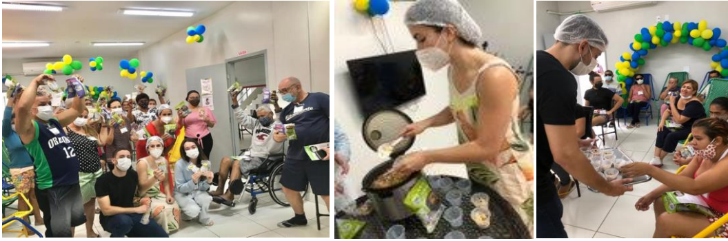
Preparo, capacitação e degustação do Mix do Bem na Casa do Interior de Goiás.