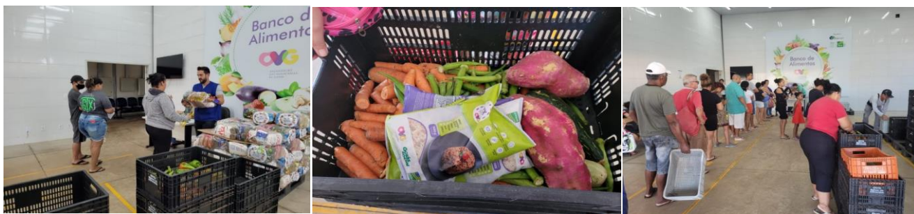
Distribuição para Famílias.