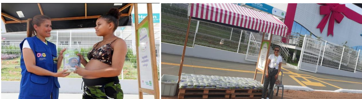
OVG Perto de Você em Trindade.