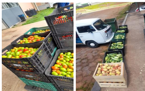
Distribuição para Entidades Sociais.