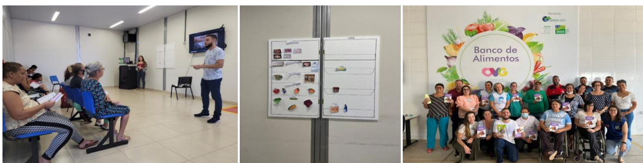
Capacitação para Famílias e Entidades Sociais.