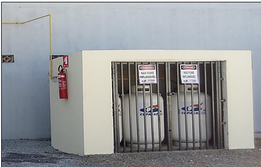
Central de gás GLP

O fornecimento e instalação de CENTRAL DE GÁS, bem como das tubulações de abastecimento até os pontos solicitados, serão executadas de acordo com a previsão de pontos indicados no projeto arquitetônico e de acordo com as demandas, dimensionamento e especificações técnicas do projeto elaborado pelo engenheiro projetista contratado. Para fins de garantia do sistema de abastecimento a ser instalado, deverá ser apresentado projeto com especificações dos itens componentes e que equipamentos constituintes sejam certificados pelo INMETRO assim como a apresentação da Anotação de Responsabilidade Técnica (ART) do engenheiro responsável. Deverá à empresa executora fornecer garantia, treinamento e manutenção preventiva e corretiva do sistema. Abaixo foto de exemplo Central de gás GLP.