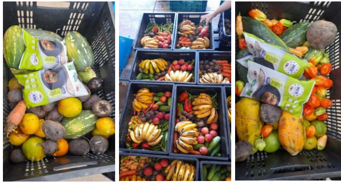
Distribuição para Famílias