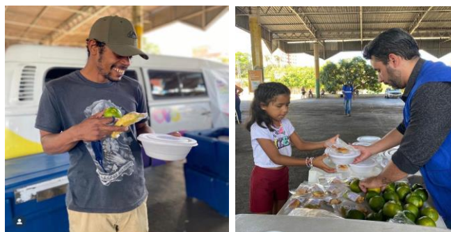
Ação "Dignidade na Rua", em parceria com a Secretaria de Estado de Desenvolvimento Social (SEDS)