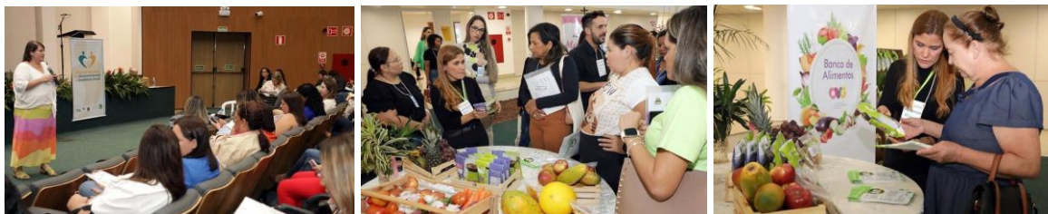
Banco de Alimentos expõe seus produtos durante o Encontro Estadual de Desenvolvimento e Assistência Social, promovido pela Secretaria de Estado de Desenvolvimento Social (SEDS), em parceria com o Gabinete de Políticas Sociais (GPS) e OVG