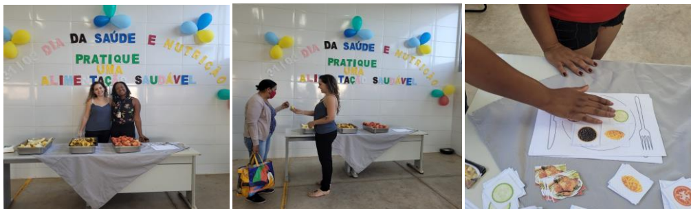
Capacitação Famílias e Entidades: Dia Nacional da Saúde e Nutrição