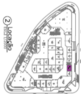
2 Locação Escala: 1/2000