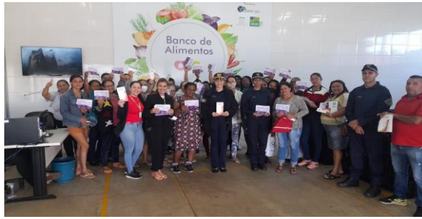
Patrulha Mulher Mais Segura - Orientações com a entrega de folders sobre a violência contra a mulher.