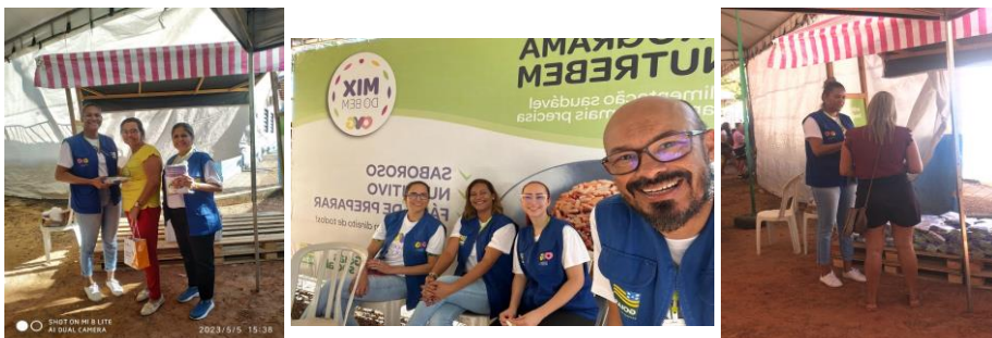
Ação OVG Perto de Você no Povoado Recanto das Araras, em Faina.