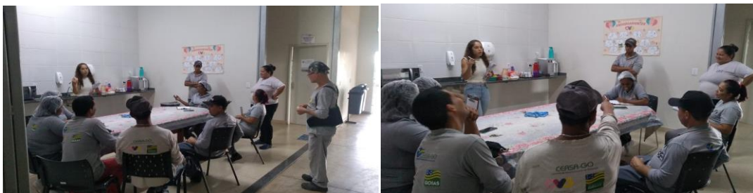
Capacitação com os Colaboradores: Dinâmica “Verdadeiro ou Falso” sobre alimentação saudável.