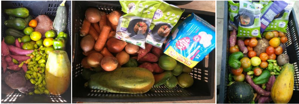
Distribuição para as Famílias.