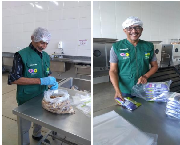
Voluntários que participaram na produção das frutas desidratadas e na montagem dos kits contendo o Mix do Bem, frutas desidratadas e guias de orientações.