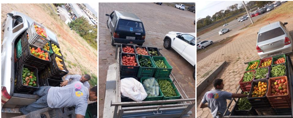
Distribuição para as Entidades Sociais.