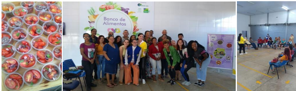
Capacitação para Famílias e Entidades: Uso de Ervas Aromáticas no Preparo das Refeições - Mês das Mães.