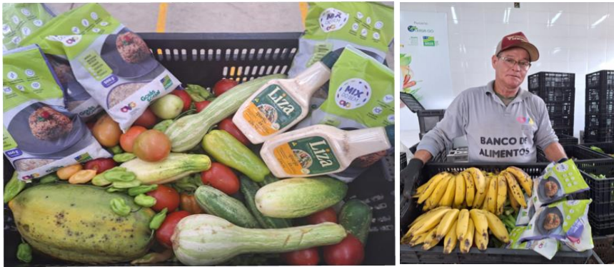
Distribuição para as Famílias.