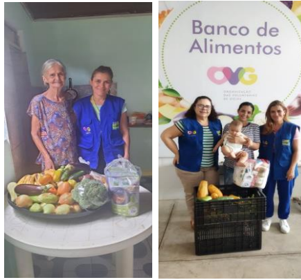
Visita técnica domiciliar e distribuição das cestas básicas doadas pela Empresa Safras e Cifras Goiânia.