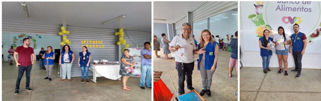
Capacitação para as Famílias e Entidades: Setembro Amarelo.