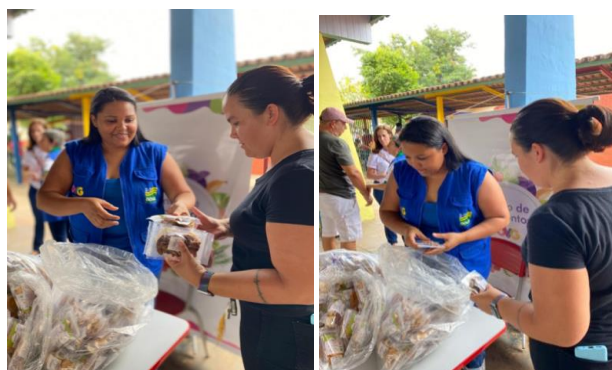
Participação na ação em alusão ao Mês de Luta da Pessoa com Deficiência: entrega de frutas desidratadas.