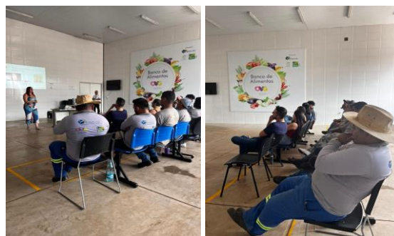
Palestra promovida pela CIPA para os colaboradores: Ergonomia, Posturas, Manuseio de Materiais, Movimentos Repetitivos e Distúrbios Músculo/Esqueleto.