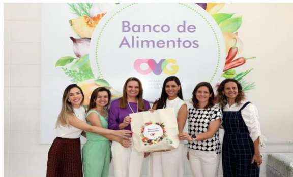
Visita da Primeira-dama do Distrito Federal para conhecer o trabalho realizado pelo Banco de Alimentos.