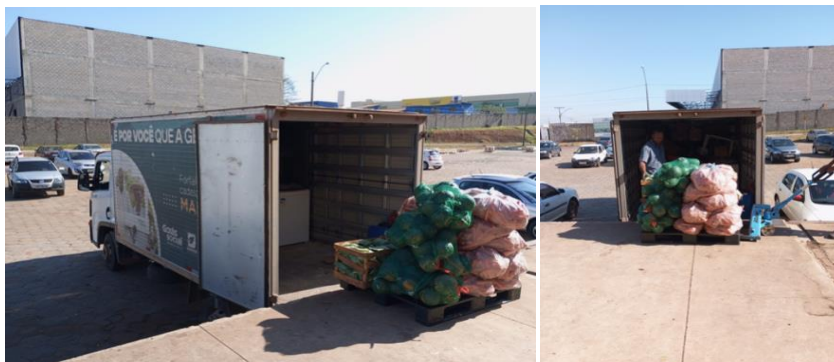
Doação de hortifrútiis para a Romaria Vão do Moleque, município de Cavalcante.