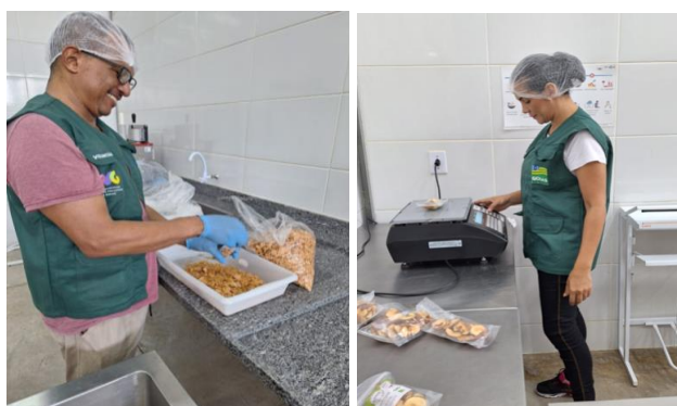
Voluntários que auxiliaram nas atividades.