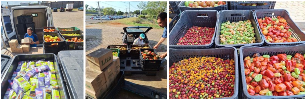
Distribuição para as Entidades Sociais.