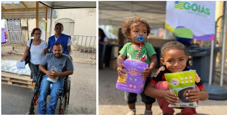
Ação OVG Perto de Você no Município de Cristalina.