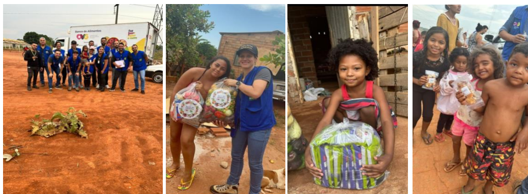
Participação na ação "Mix do Bem, Combate à Insegurança Alimentar", através do Goiás Social, no município de Aparecida de Goiânia.