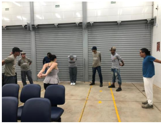
Capacitação para famílias e colaboradores com o tema "Saúde do Homem" e aula de alongamento para colaboradores após finalização da palestra.