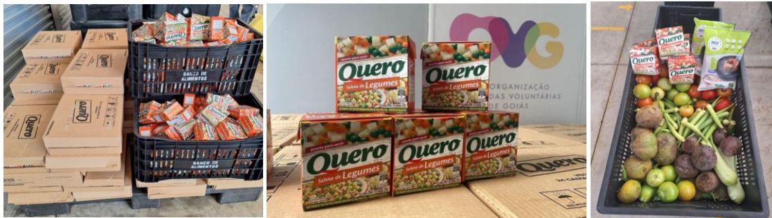
Distribuição da Selete de Legumes, recebidas por meio de doação, para as Famílias e Entidades Sociais Cadastradas.