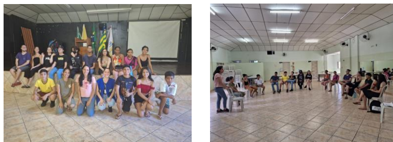
Capacitação entidade: "A influência da mídia no comportamento alimentar dos adolescentes".