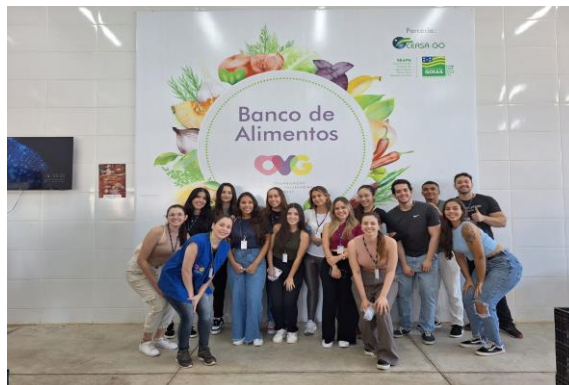
Visita dos Estudantes do Curso de Nutrição da Universidade Federal de Goiás.