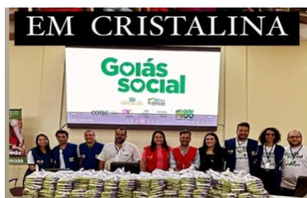
Entrega do Mix do Bem juntamente com a entrega dos Cartões do Programa Crédito Social, no Município de Cristalina.