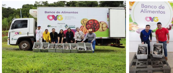
Doação de 400 kg de Peixes recebidos da EMATER e distribuidos para as Entidades.