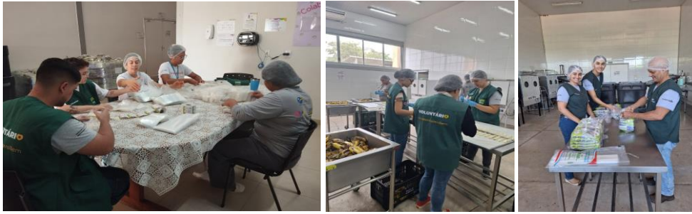
Voluntários do mês, do Programa de Voluntariado Cooperativo da Cargill, que auxiliaram nas atividades.