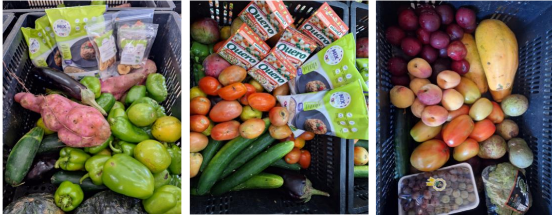
Distribuição para as Famílias.