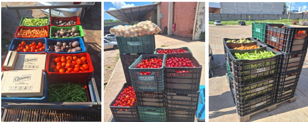
Distribuição para as Entidades Sociais.