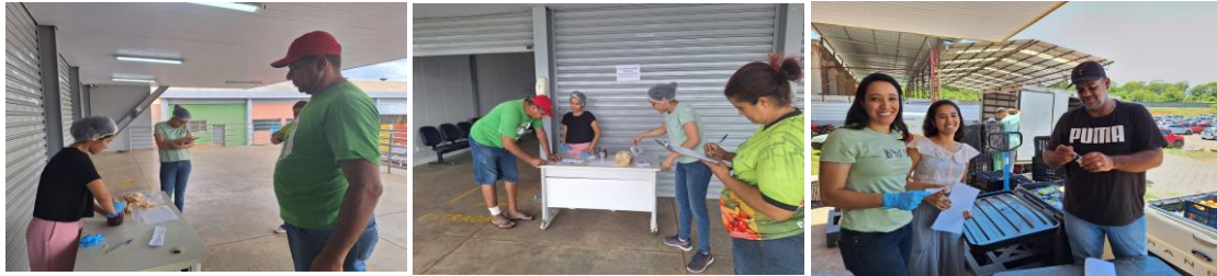
Capacitação com as entidades: Controle de qualidade dos alimentos doados pelo Banco de Alimentos.