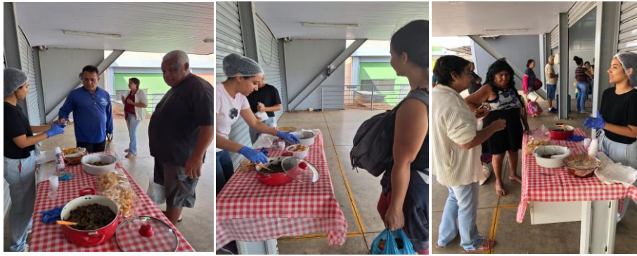
Capacitação com os beneficiários: Receitas com aproveitamento dos principais alimentos relatados pelos beneficiários do Banco de Alimentos.