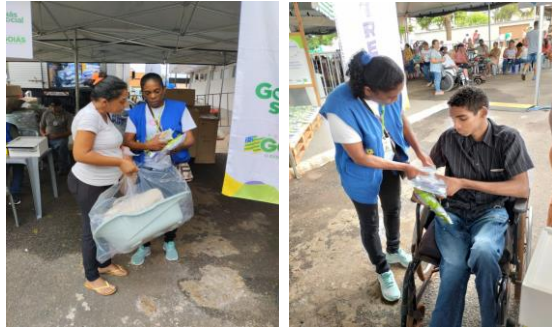
Ação OVG Perto de Você no município de Acreúna.