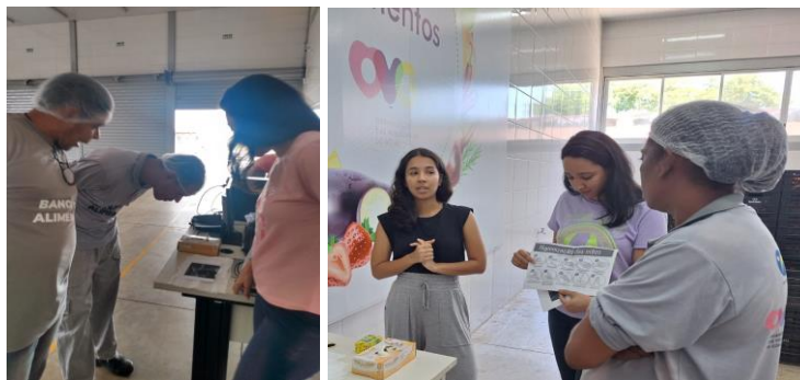
Capacitação com os colaboradores: O uso do EPI (equipamento de proteção individual) e o controle de qualidade dos alimentos.