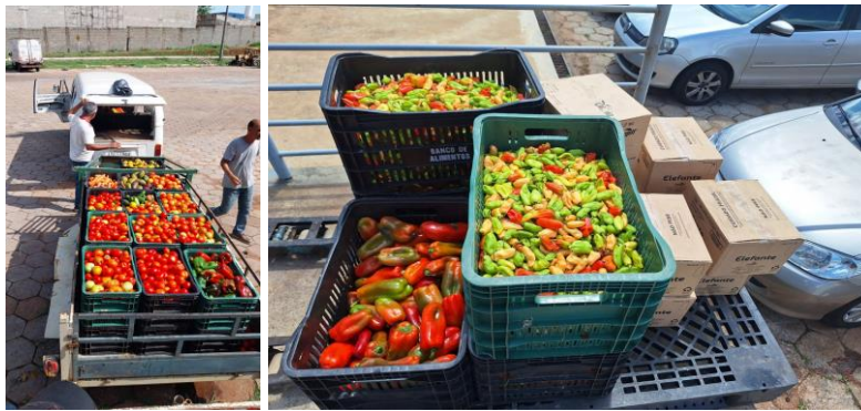
Distribuição para as Entidades Sociais.