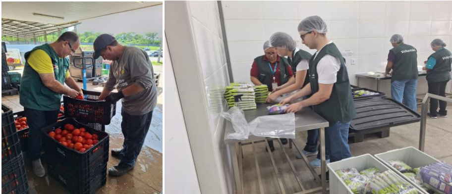
Voluntários que atuaram nas atividades, sendo 1 voluntário encaminhado pela GVPS e 10 voluntários da empresa Cargill.