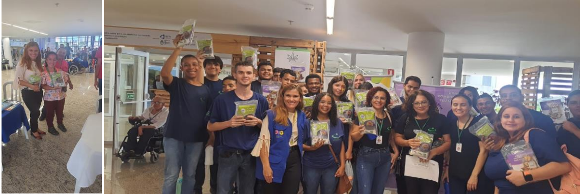
Participação no evento em comemoração ao Dia Internacional das Pessoas com Deficiência.