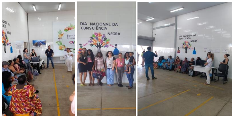
Capacitação com os beneficiários, colaboradores e entidades: Dia da Consciência Negra.