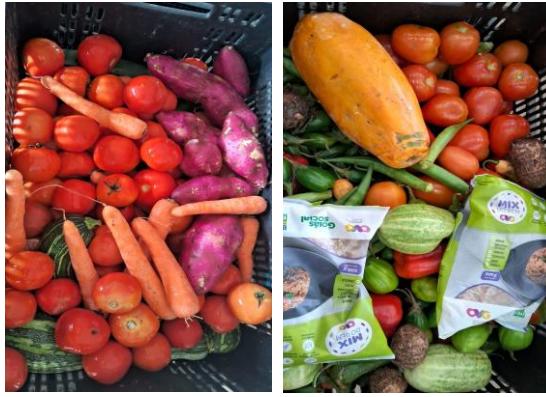
Distribuição para as Famílias.