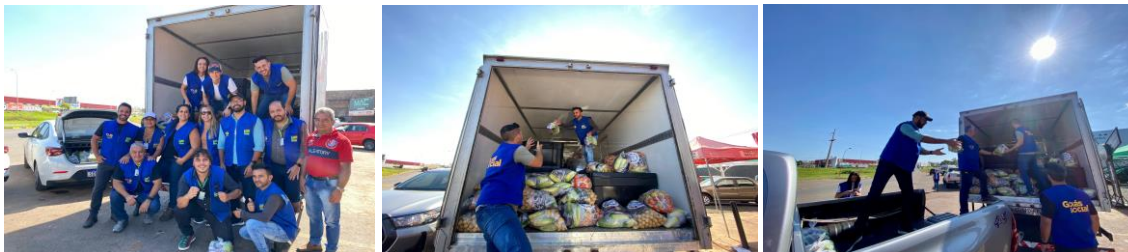
Ação Mix do Bem, Combate à Insegurança Alimentar, nos municípios de Luziânia e Valparaíso de Goiás.