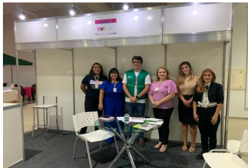
Participação no Workshop Criando Bases para a Liberdade: Encerramento do curso promovido pela Defensoria Pública do Estado de Goiás "Elas Dizem Não".