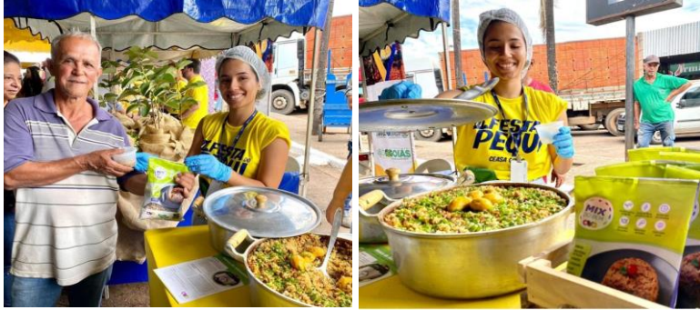
Participação na 3ª Edição da Festa do Pequi, organizada pela CEASA.