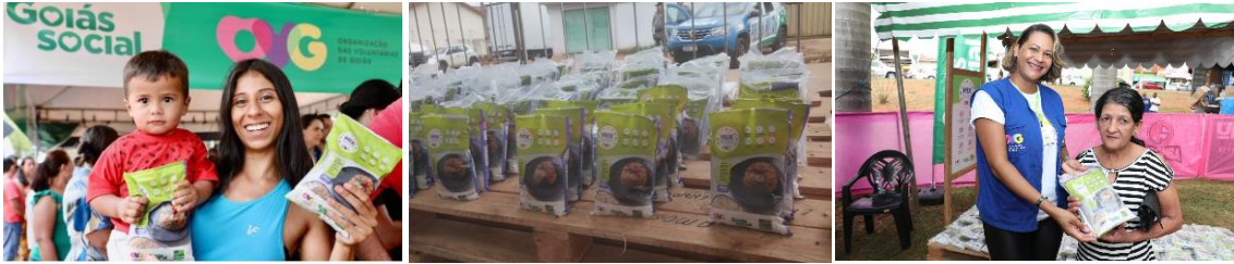
Ação OVG Perto de Você em Bela Vista, Caldas Novas e Catalão.