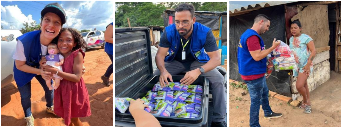
Ação em comemoração ao Dia Das Crianças para famílias em Aparecida de Goiânia.