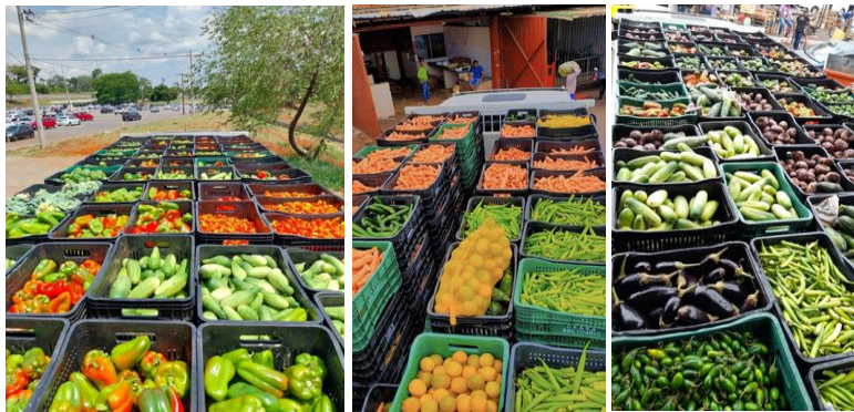
Doações recebidas no mês de Outubro.