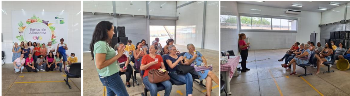
Capacitação com os beneficiários e colaboradores: Outubro Rosa.