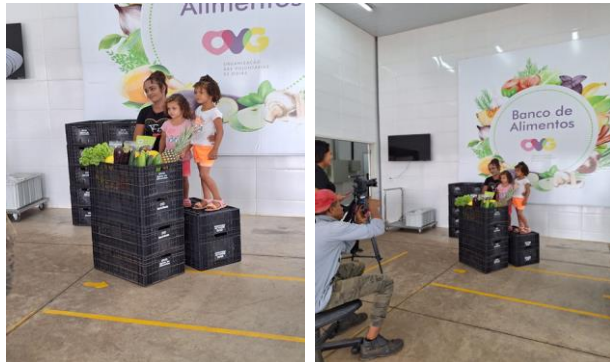
Produção de Vídeo Institucional no Banco de Alimentos.