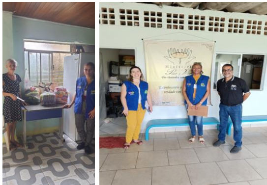
Visitas Técnicas: Famílias e Entidades.