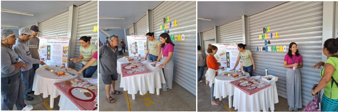
Capacitação com os beneficiários e colaboradores: Dia Mundial da Alimentação.