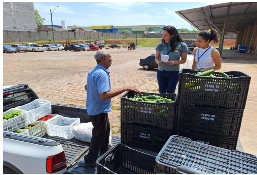
Capacitação com as Entidades: Forma Segura de Transportar os Alimentos.