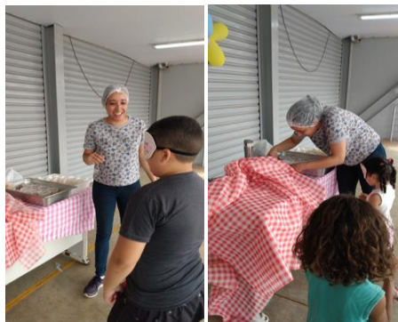
Capacitação com os beneficiários: Dia das Crianças.