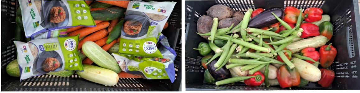
Distribuição para as Famílias.