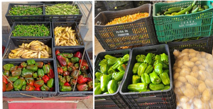
Distribuição para as Entidades Sociais.