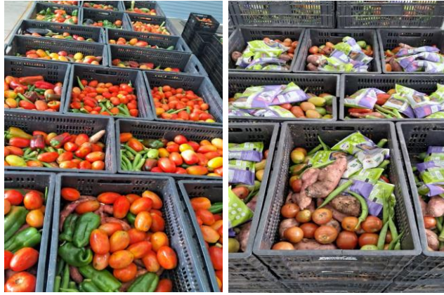
Distribuição para as Famílias.