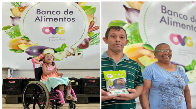
Famílias de pessoas com deficiência recebem amparo no Banco de Alimentos.