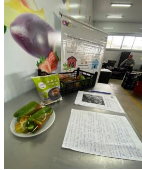
Capacitação para Famílias, Entidades Sociais e Colaboradores: De onde vem esse alimento?