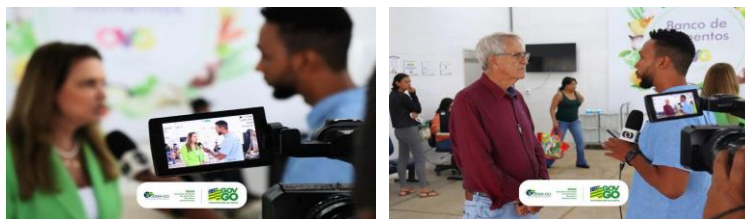
Divulgação do Banco de Alimentos na imprensa: gravação com TV Anhanguera e PUC TV.