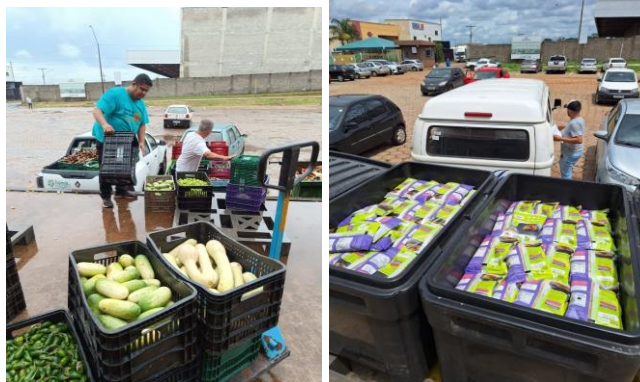
Distribuição para as Entidades Sociais.