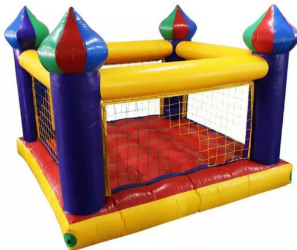
Escorregador Infantil Play Júnior

Castelinho inflável (imagem meramente ilustrativa)