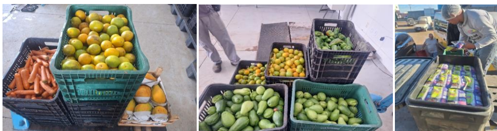
Distribuição de alimentos para as Entidades Sociais.