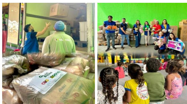
Participação no Projeto Levando Amor realizado no Bairro Terra do Sol, em Aparecida de Goiânia.