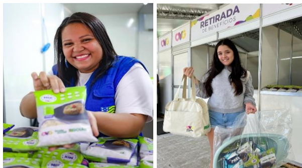
Participação na Ação OVG Perto de Você no evento do Goiás Social, realizada no Município de Bela Vista de Goiás.