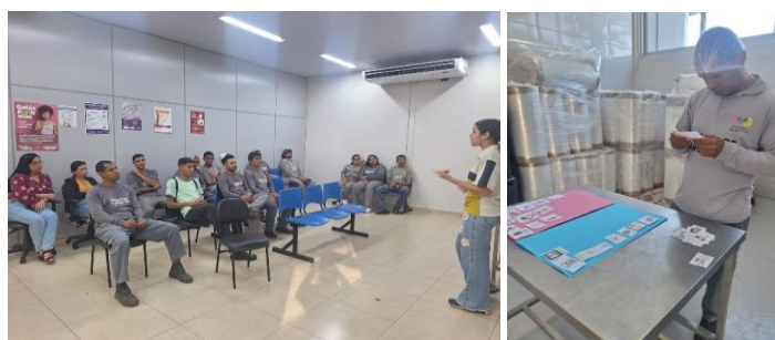
Ação educativa com os colaboradores da produção do Banco de Alimentos.