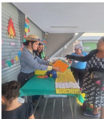
Capacitação para as famílias, realizada em parceria com o PETNut/UFG, com temática junina.