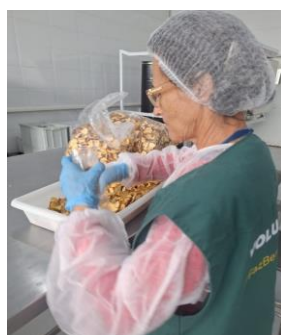
Atuação de voluntária no apoio à atividade de empacotamento.