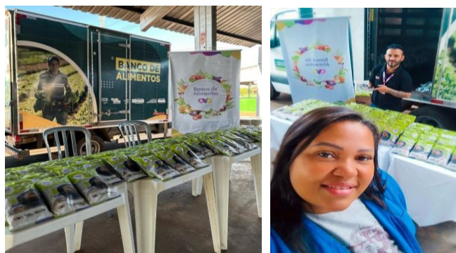
Participação no Programa Agro Social em São Luís de Montes Belos.