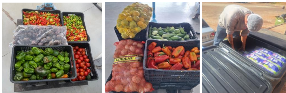
Distribuição de alimentos para as Entidades Sociais.