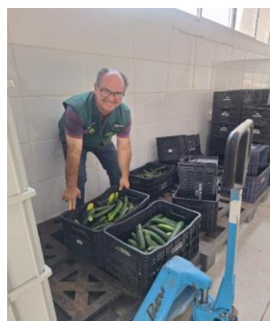
Atuação de voluntário no apoio das atividades.