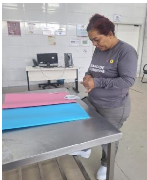
Capacitação para Colaboradores com dinâmica interativa.