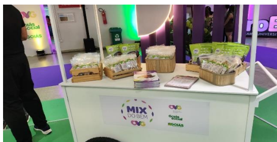
Participação na Feira de Oportunidades e Evento de Inclusão do PROBEM.