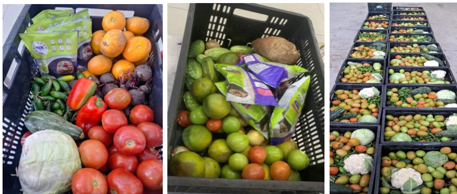
Distribuição de alimentos para as Famílias.