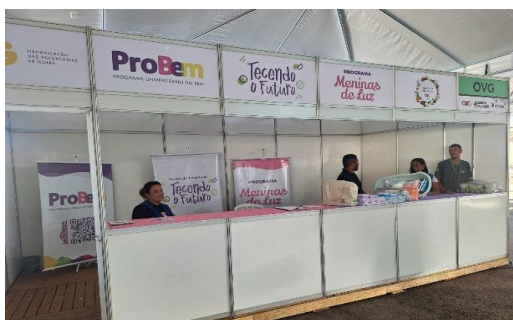
Participação na 1ª edição do Goiânia + Humana: Mutirão de serviços e ações sociais.