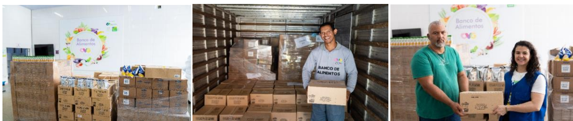
Doação de alimentos realizada pela empresa Cargill ao Programa Banco de Alimentos da OVG, destinada ao fortalecimento das ações de segurança alimentar e nutricional, por meio do atendimento às famílias em situação de vulnerabilidade social.