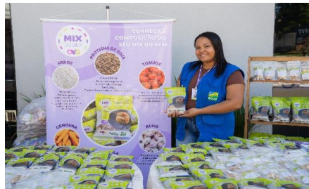
Participação na inauguração do Restaurante do Bem em Santa Helena de Goiás, com exposição e entrega de Mix do Bem, frutas desidratadas e manual de preparo e conservação dos alimentos.