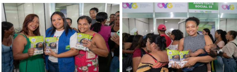
Participação em ação do Goiás Social realizada no município de Campos Belos, com atendimento e orientações à população.