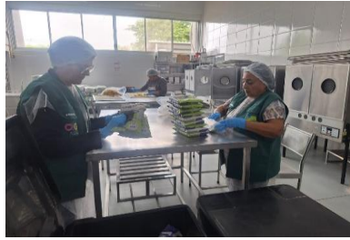
Voluntárias prestando apoio às atividades de empacotamento de alimentos.