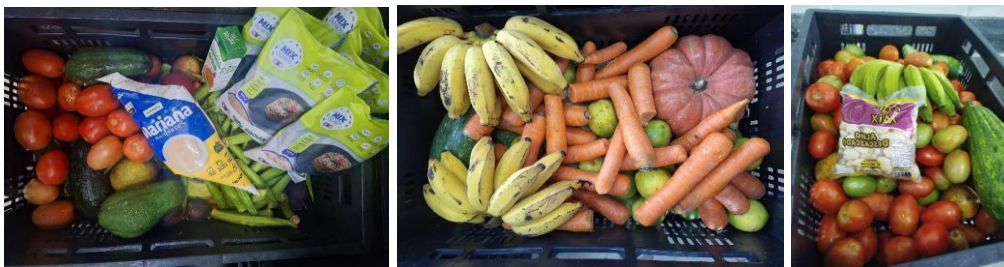
Distribuição de alimentos para as Famílias.