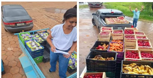
Distribuição de alimentos para as Entidades Sociais.