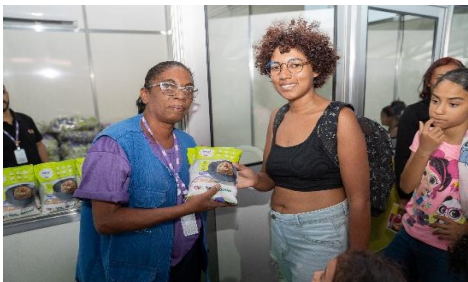
Ação Goiás Social Mulher realizada na Praça Cívica, em Goiânia.