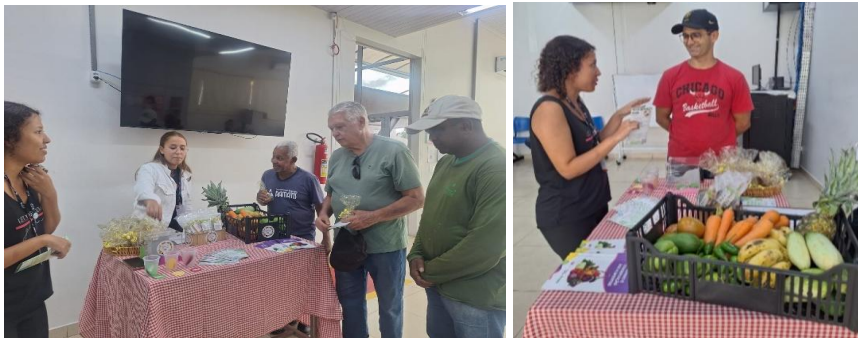
Capacitação com as entidades sociais cadastradas no Banco de Alimentos, com foco no aproveitamento adequado dos alimentos recebidos.