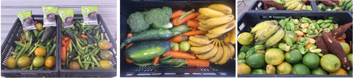
Distribuição de alimentos para as Famílias.